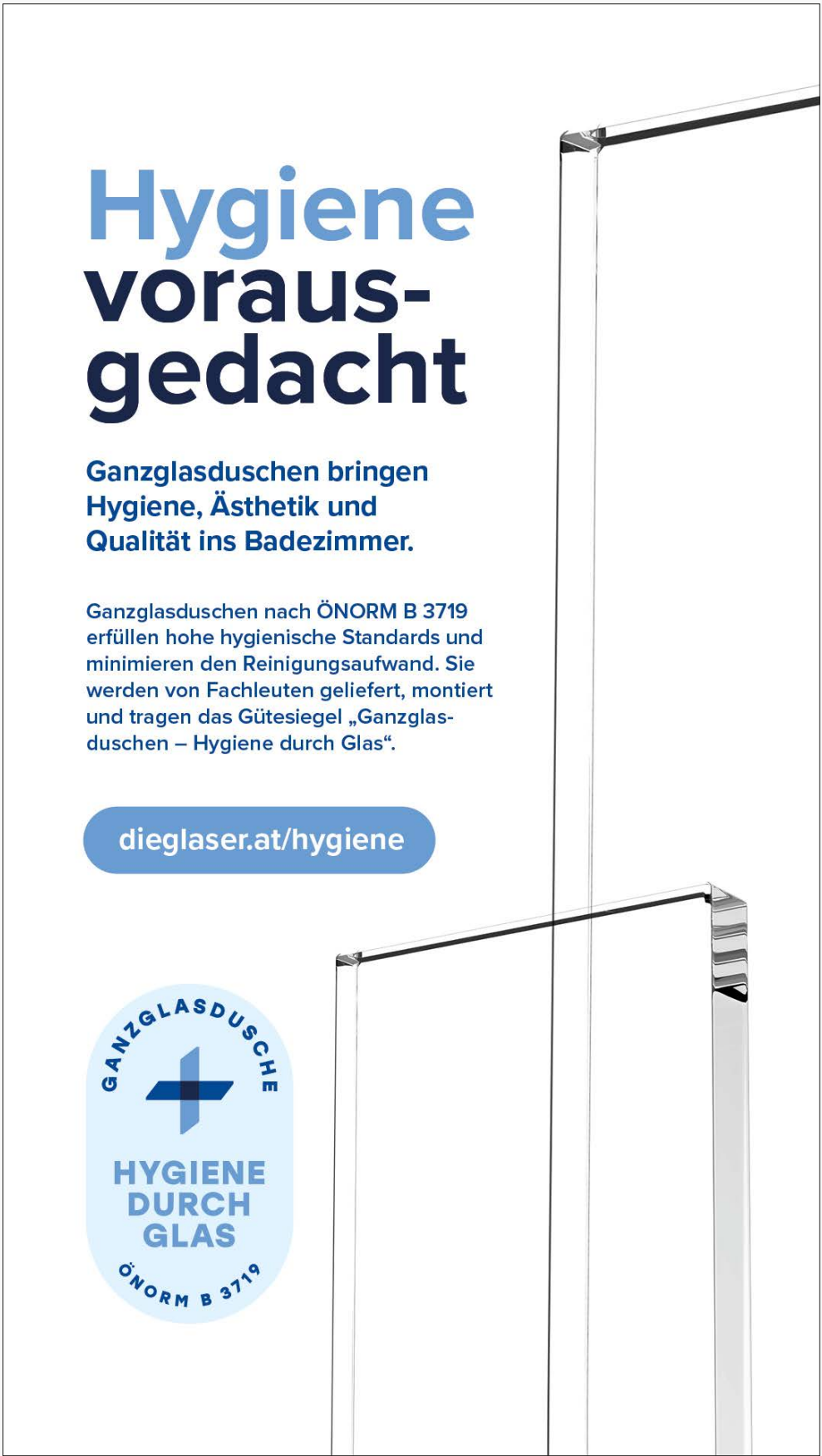
Instagram & WhatsApp Story