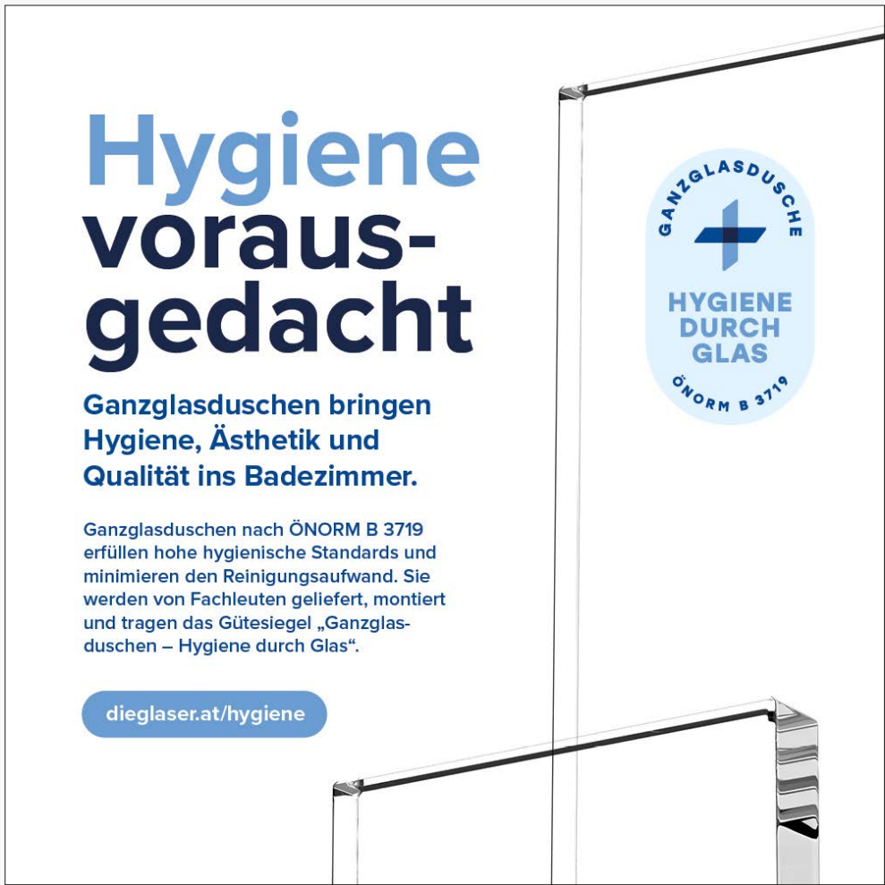
Instagram Beitrag 1:1