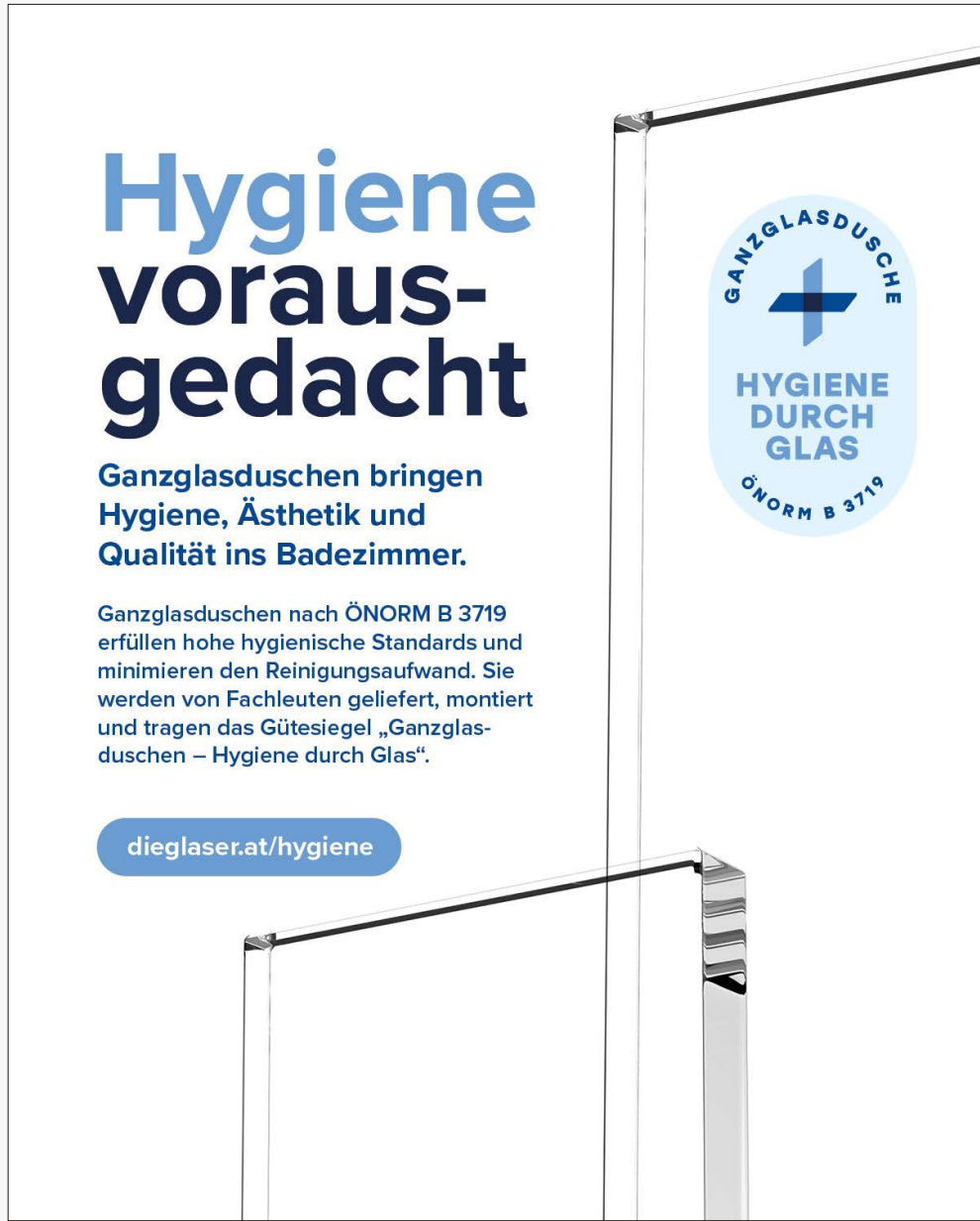
WhatsApp + Instagram Beitrag 4:5