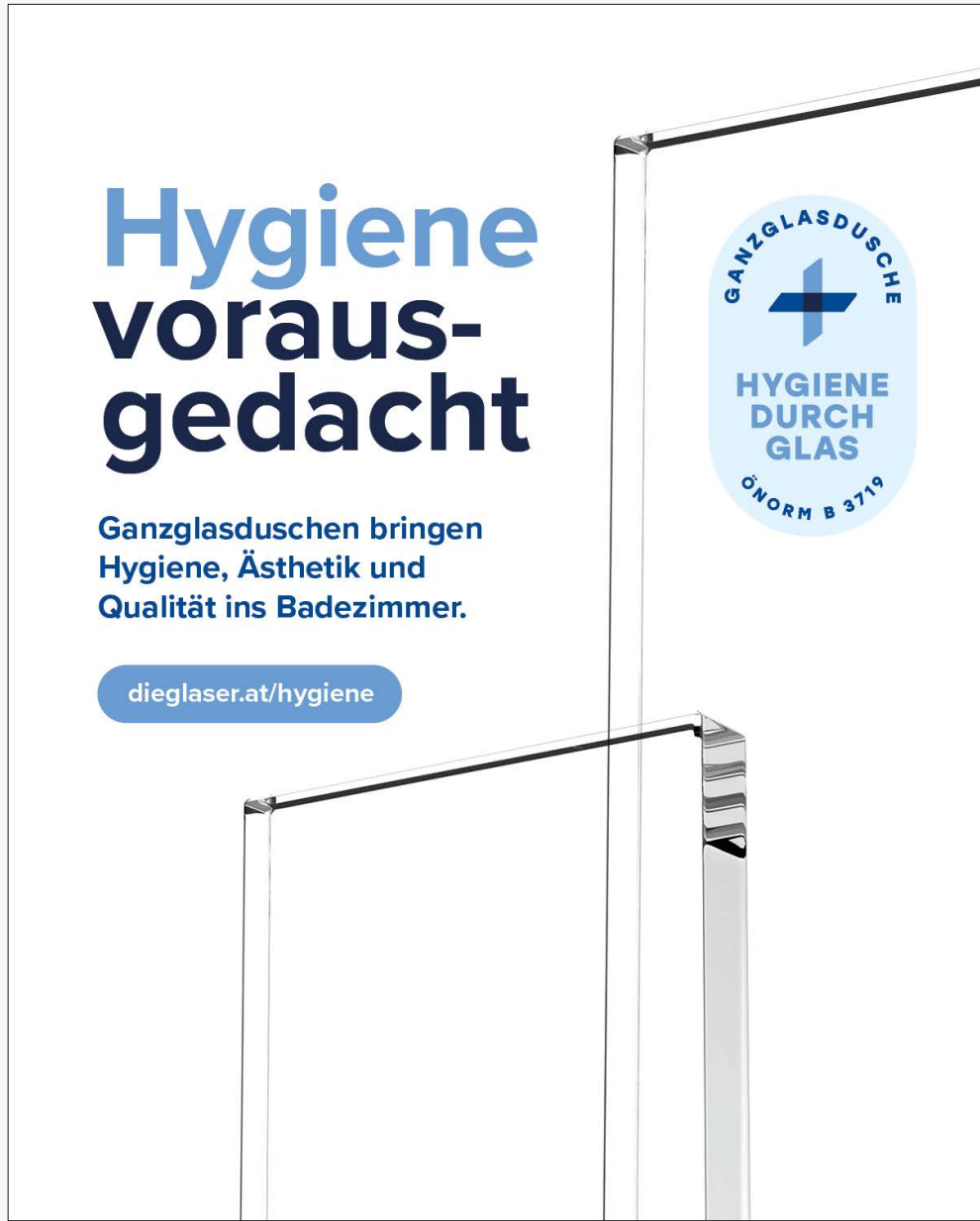
WhatsApp + Instagram Beitrag 4:5