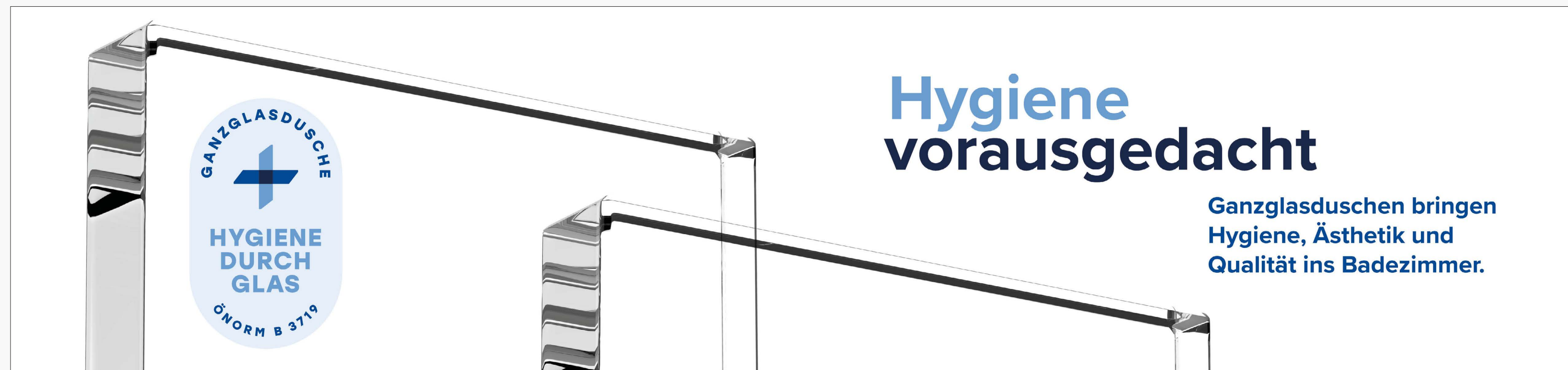
Web-Banner für Webseiten

Dieser Webbanner kann auf Ihrer Website integriert werden, um Besucher:innen direkt auf die Vorteile von Ganzglasduschen aufmerksam zu machen. Nutzen Sie dieses Medium, um gezielt Interesse zu wecken und Informationen zu vermitteln.