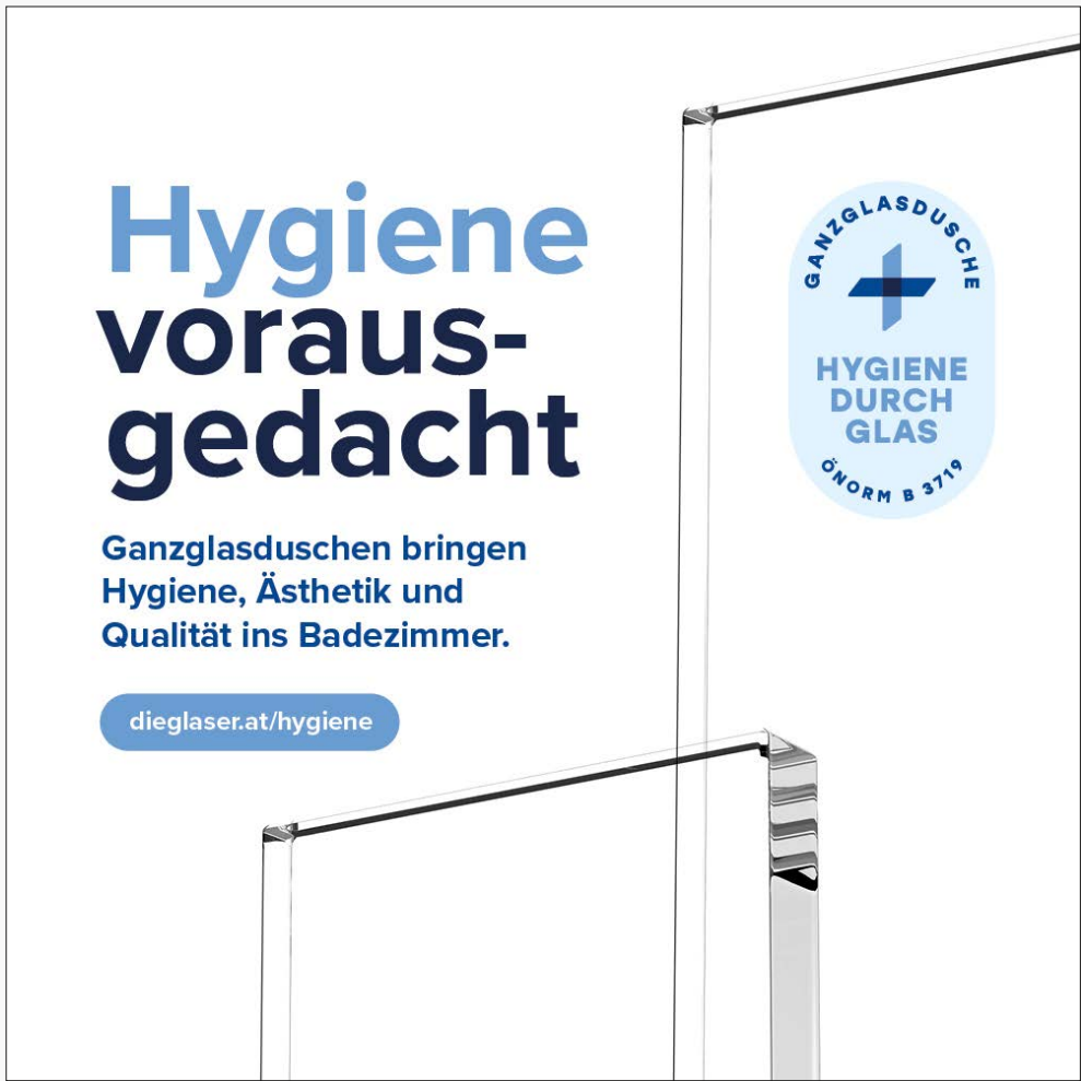
Instagram Beitrag 1:1

Um die Reichweite zu maximieren sollten Sie diese Beiträge in Ihren sozialen Netzwerken teilen. Plattformen wie Facebook, Instagram und WhatsApp eignen sich dafür besonders gut.