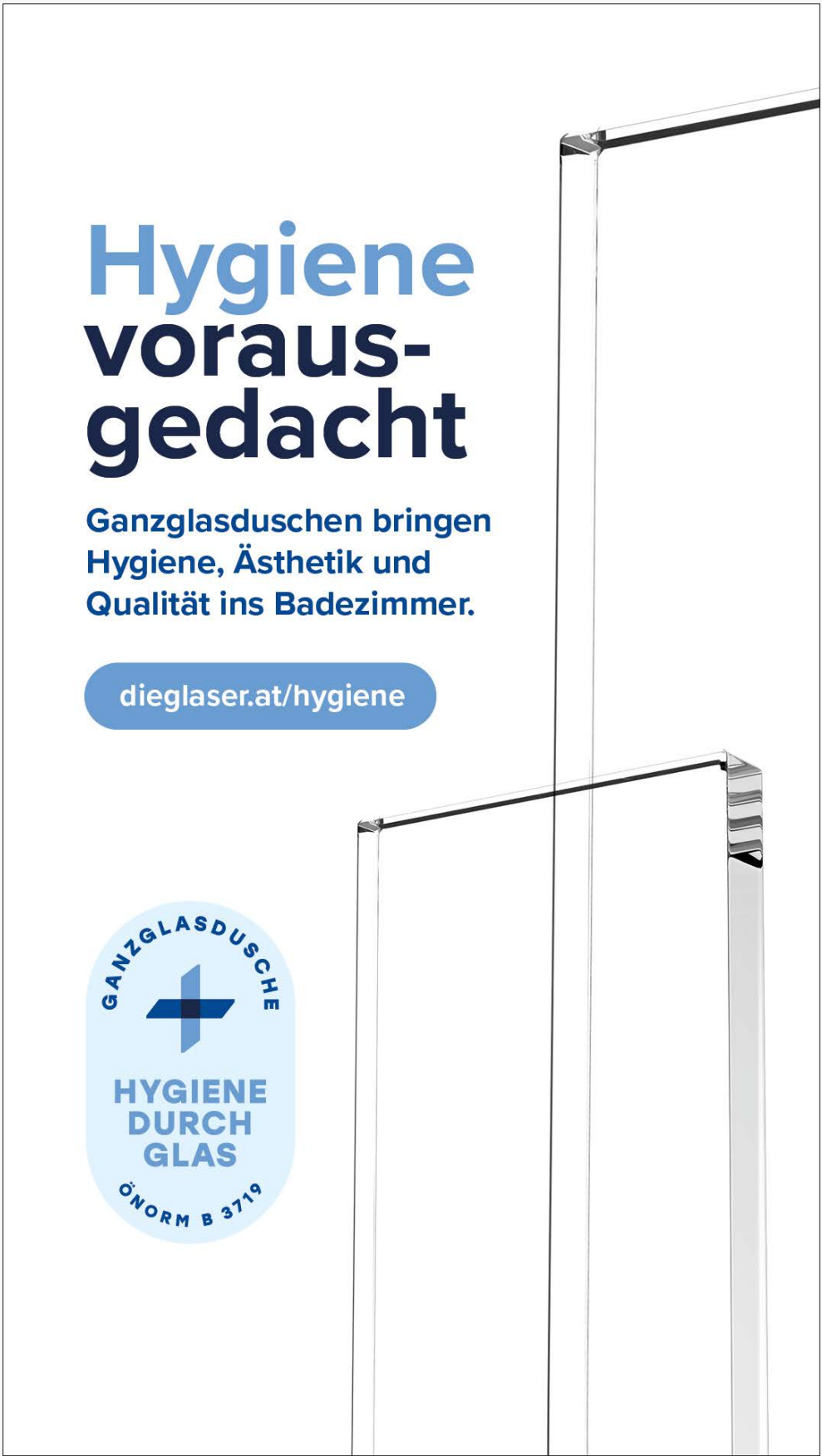
Instagram & WhatsApp Story