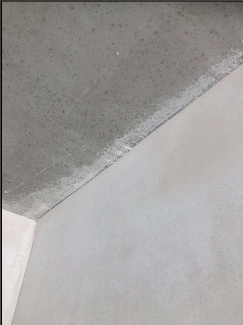
Malerforum 8. Februar 2022