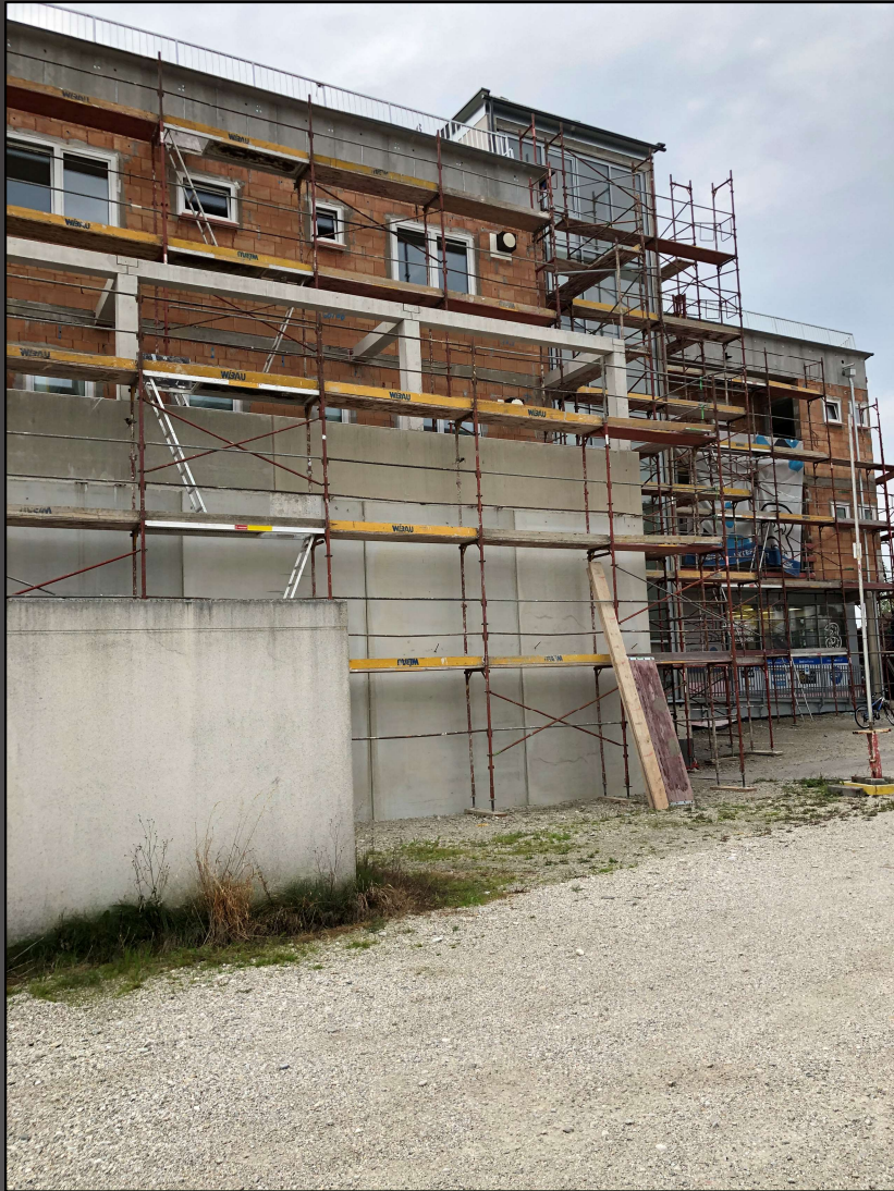
Malerforum 8. Februar 2022