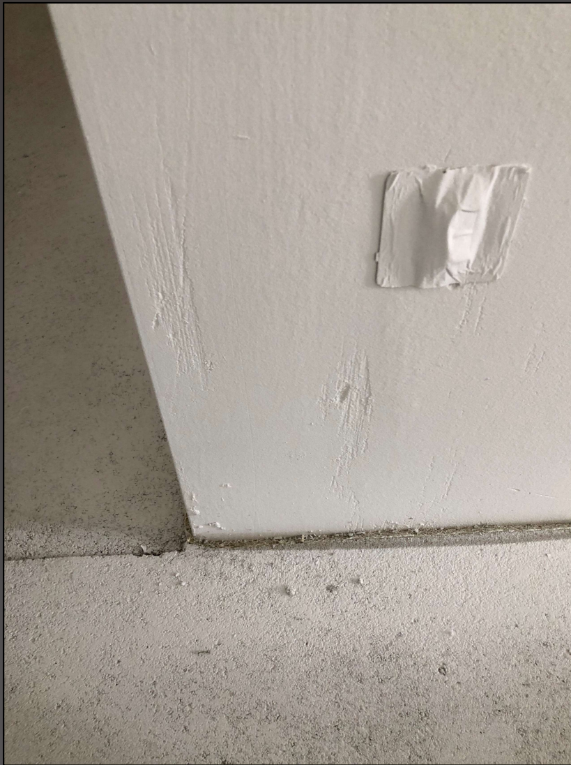
Malerforum 8. Februar 2022