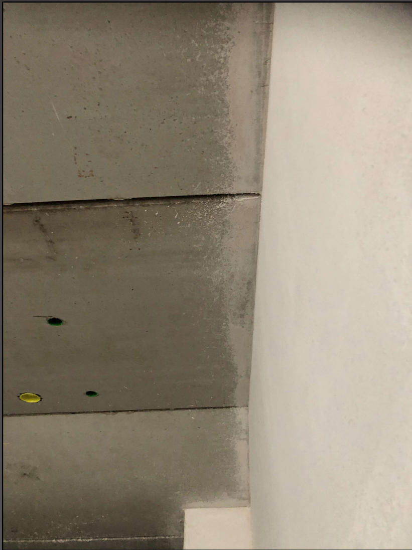
Malerforum 8. Februar 2022