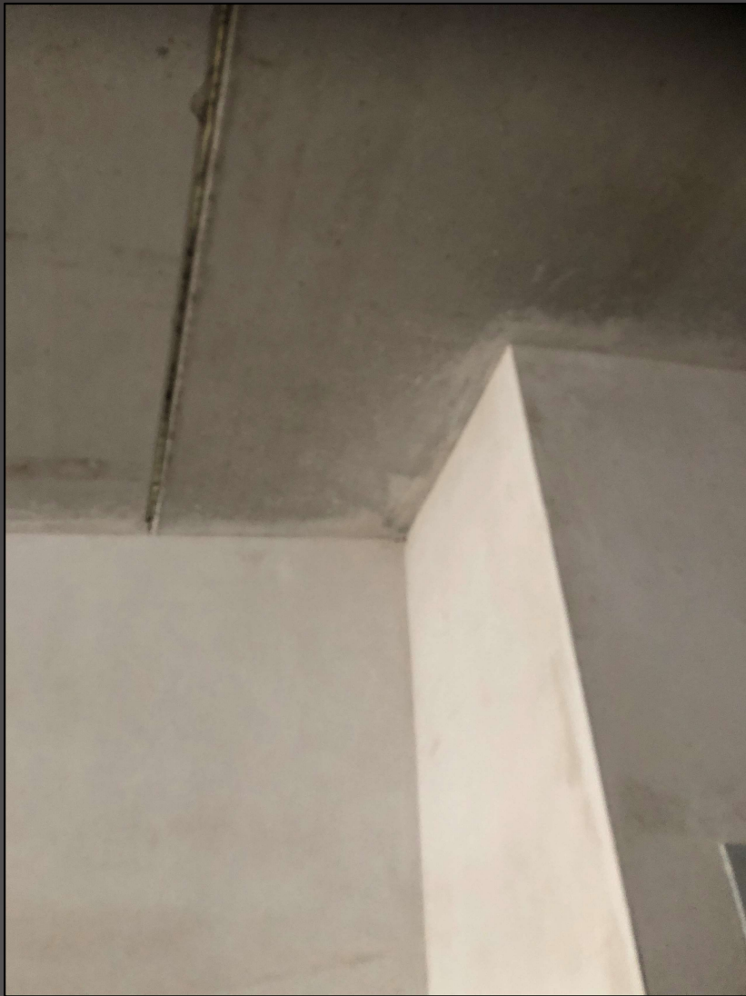
Malerforum 8. Februar 2022