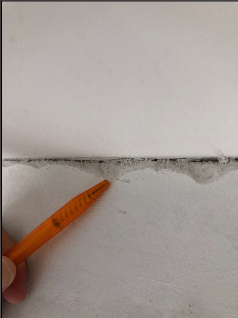
Malerforum 8. Februar 2022