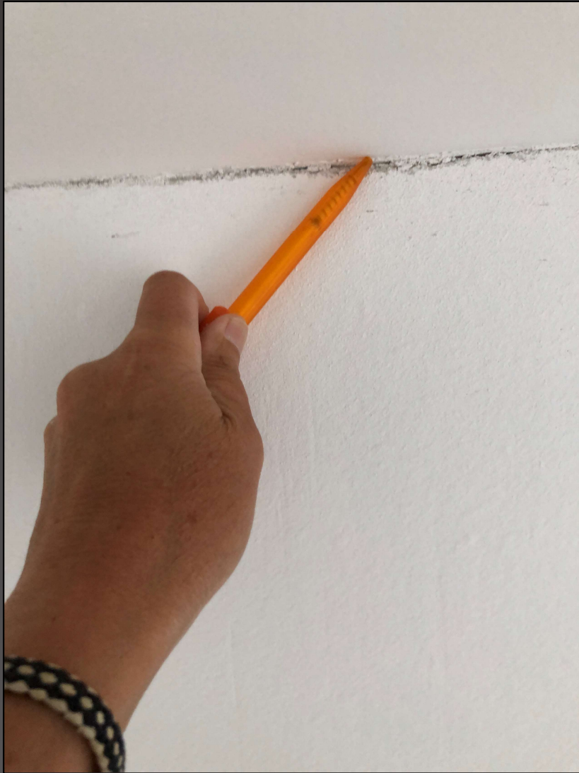
Malerforum 8. Februar 2022