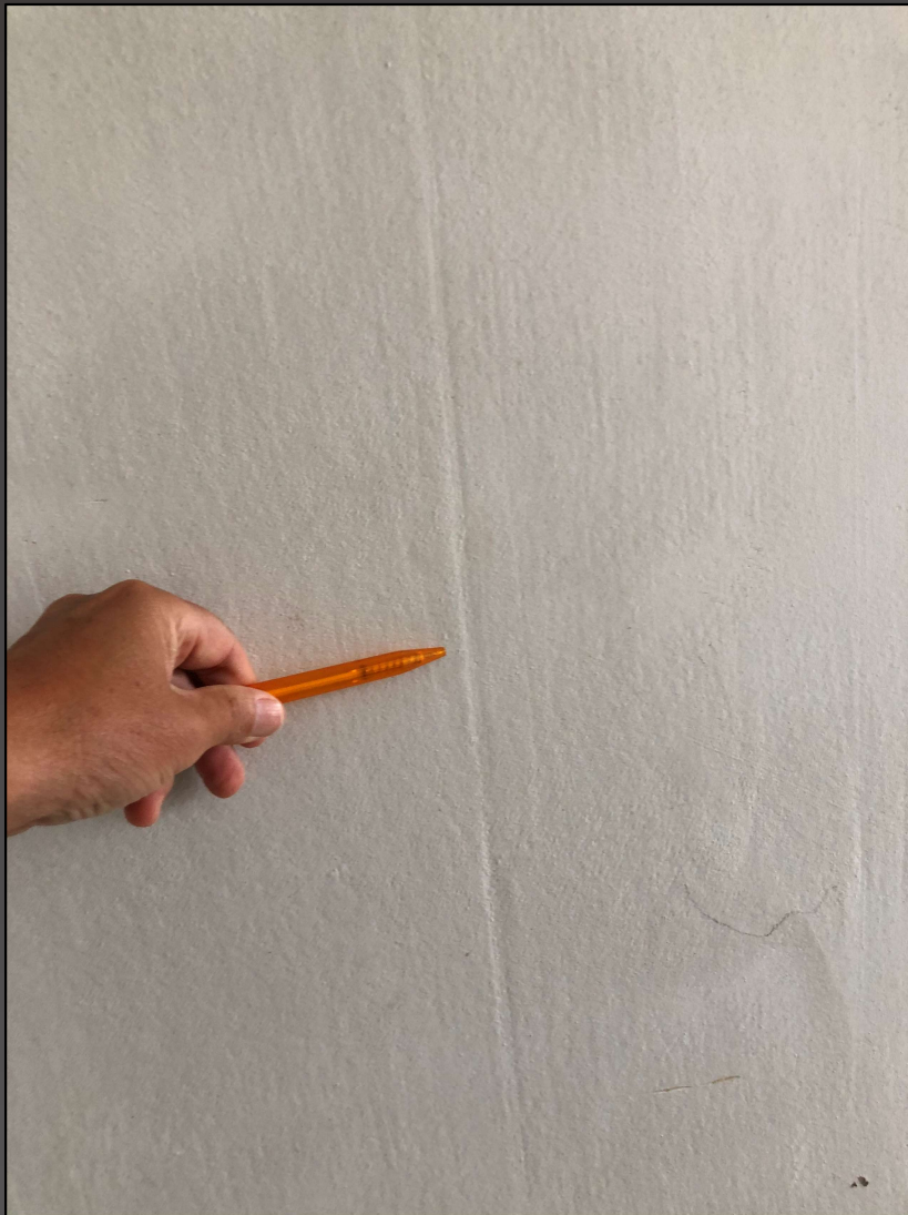
Malerforum 8. Februar 2022