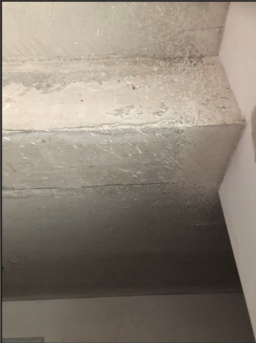
Malerforum 8. Februar 2022