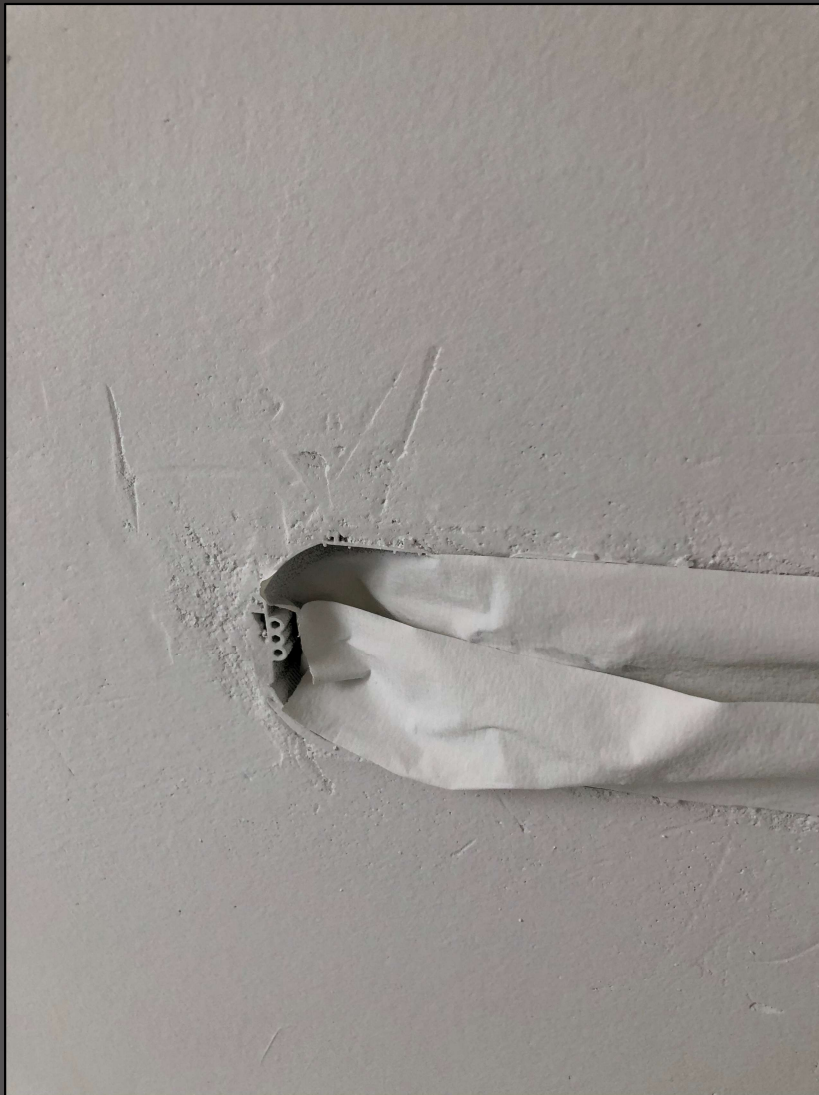
Malerforum 8. Februar 2022