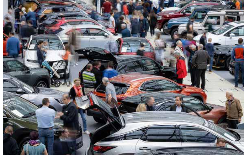
Gustieren am Linzer Autofrühling