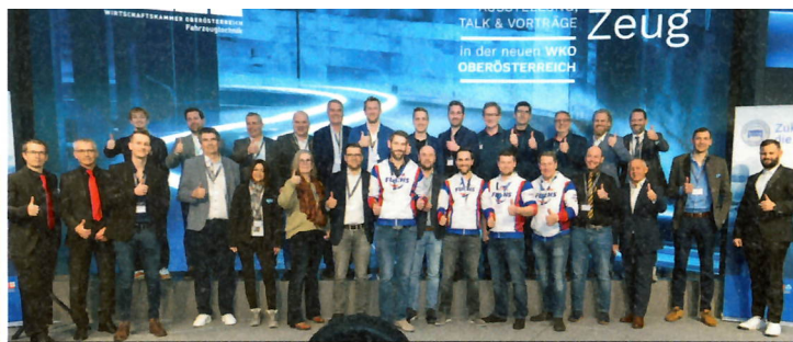
Aussteller und Unterstützer vom 43. Tag der Kfz-Wirtschaft OÖ 2025.