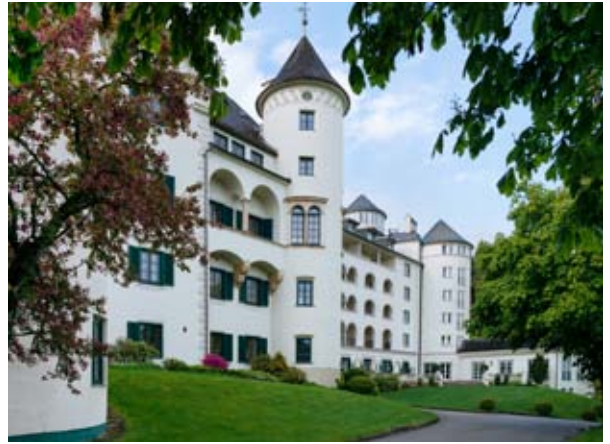
© Richard-Schabetsberger; Romantik Hotel Schloss Pichlarn