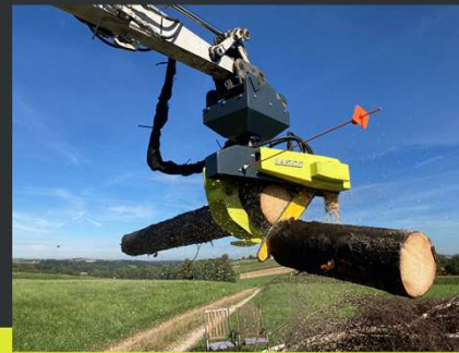
Greifersäge & Greiferägre mit Kegelspalter