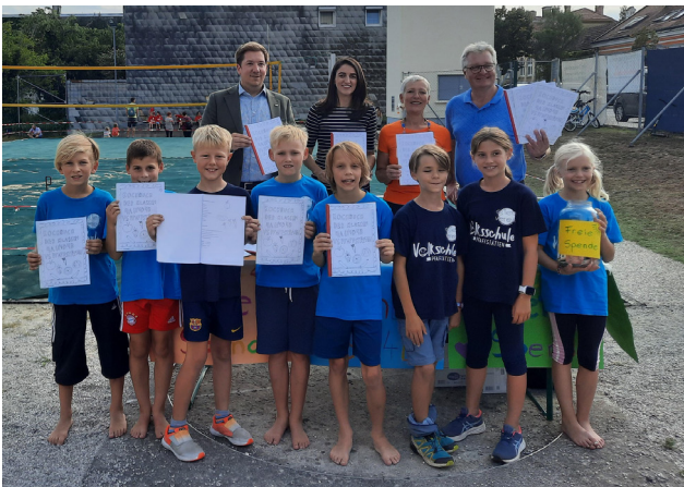
Schüler:innen der Volksschule Pfaffstätten, NÖ (2023)