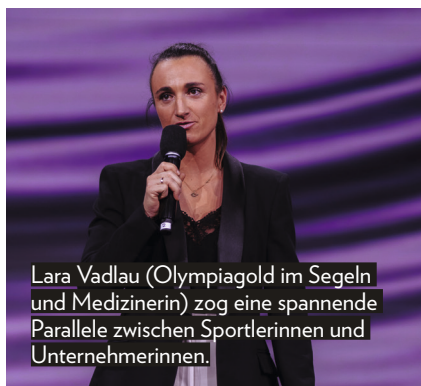
Lara Vadlau (Olympiagold im Segeln und Medizinerin) zog eine spannende Parallele zwischen Sportlerinnen und Unternehmerinnen.

des Jahres, Unternehmerin mit besonderer Leistung und Unternehmerin mit Lebenswerk. Die feierliche Übergabe der einzigartigen Trophäen, gestaltet im Stil des Logos von „Frau in der Wirtschaft“, war für die Preisträgerinnen ein Höhepunkt des Abends.