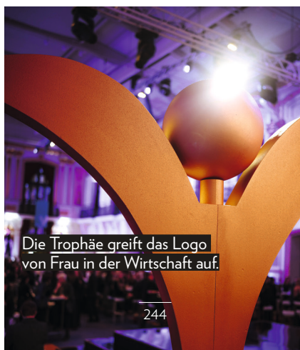
Die Trophäe greift das Logo von Frau in der Wirtschaft auf.