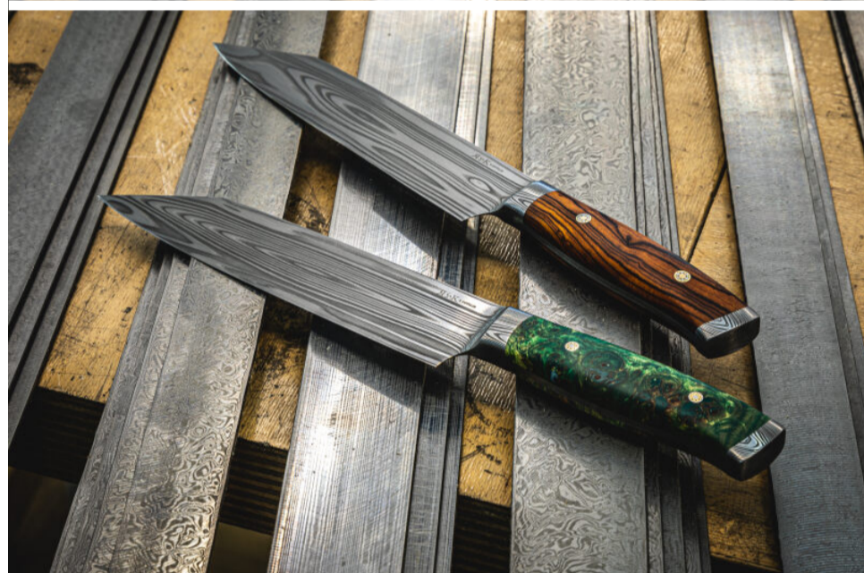
Schneidige und elegante Werkzeuge zeigen die Messermacher Kappeller