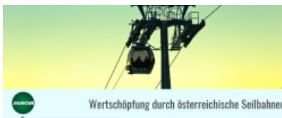
Wertschöpfung durch alpine Wintersportler im Winter 2018/19. Erhebungszeitraum August 2019