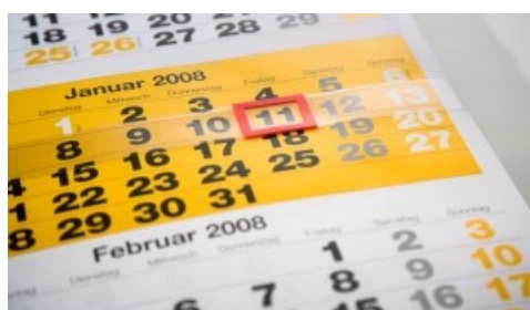
Prüfungstermine Meisterprüfungsstelle Kärnten