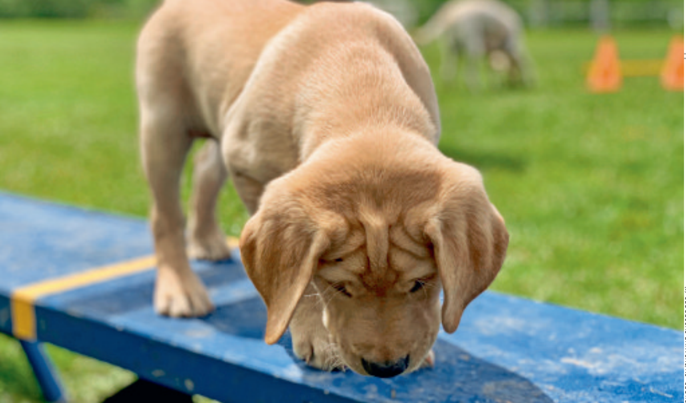
BILDER: SN/SUSANNE RUSSEGER (2)