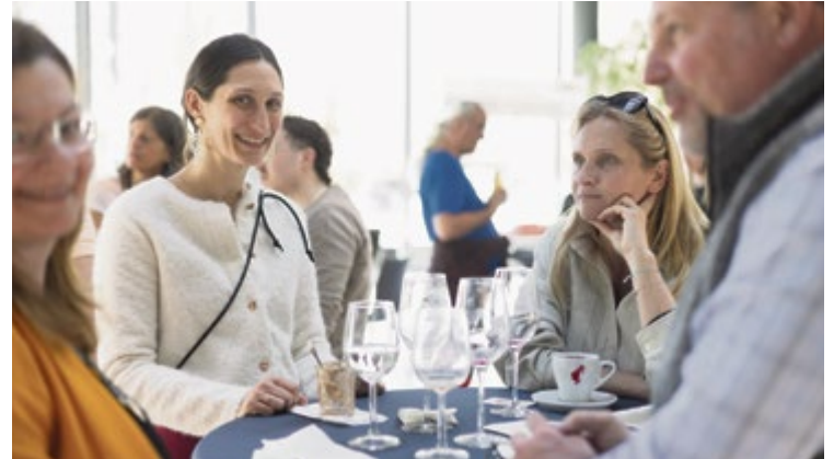
Rund 300 Veranstaltungen mit mehr als 20.600 Teilnehmern pro Jahr, in unterschiedlichen Formaten laden zum Vernetzen ein.

Für den regelmäßigen Austausch mit Gleichgesinnten organisiert die Junge Wirtschaft Salzburg verschiedene Veranstaltungsformate. Ein High-