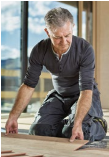
Die meisten EPU arbeiten in der Sparte Gewerbe und Handwerk.

Nach der Umsatzentwicklung von 2024 auf 2025 betrachtet verzeichnen drei Viertel der EPU stabile beziehungsweise wachsende nominelle Umsätze. Gleichzeitig erzielte ein Viertel der EPU 2025 einen Jahresumsatz von mehr als 100.000 €.