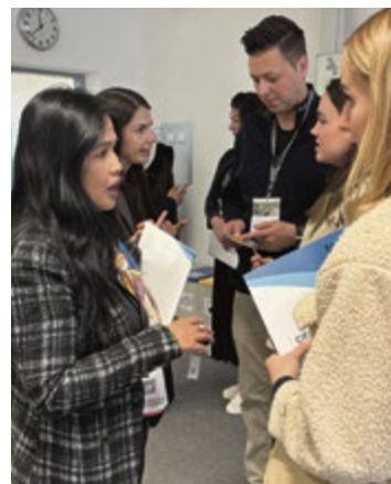
Erfolgreiche Vermittlung von Arbeitskräften aus den Philippinen.

„Internationale Fachkräfte leisten einen entscheidenden