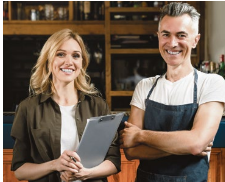
Ausbildung im WIFI: Im Tourismus wird der zweite Bildungsweg zum Sprungbrett für eine erfolgreiche Karriere.

Der Tourismus zählt zu den wenigen Wirtschaftszweigen, in denen Erfahrung, Persönlichkeit und praktische Fähigkeiten ebenso stark zählen wie der klassische Ausbildungsweg. Ob in der Küche, im Service, in der Gästebetreuung oder im Hotelbetrieb: Gefragt sind Menschen, die anpacken, mitdenken und Verantwortung übernehmen. Gerade