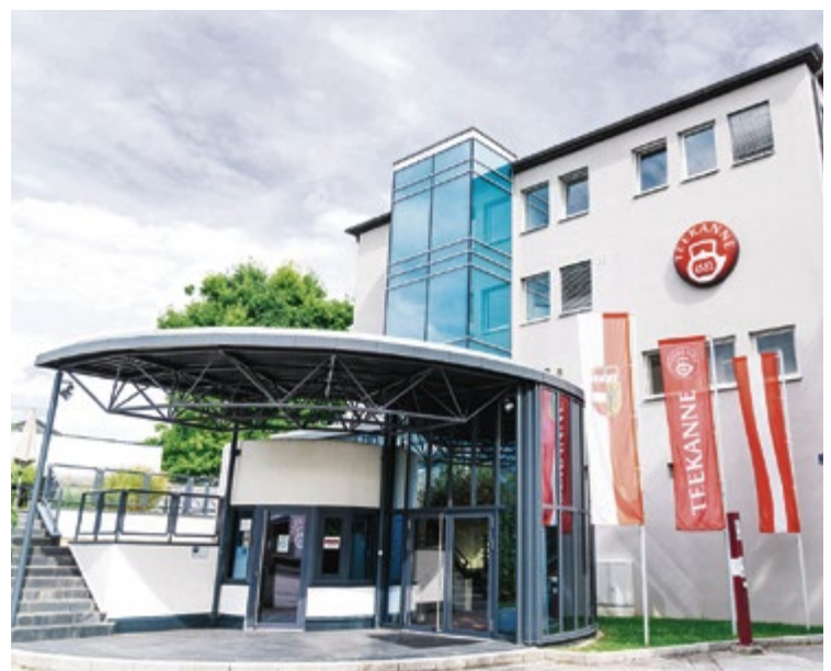
Seit 1951 ist Teekanne Österreich in Salzburg-Lieferung ansässig. Die Jahresproduktion beträgt etwa eine Milliarde Teebeutel.