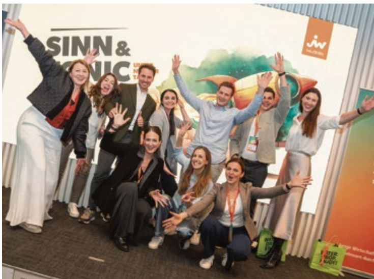
Der Vorstand der Jungen Wirtschaft freut sich über den gelungenen Jungunternehmeritag „Sinn & Tonic“.

Erstmals gehen die Sommerfeste der JW auf Tour durch Salzburg. Unter dem Motto: „Erleben, vernetzen, inspirieren“, stehen Unternehmergeschichten, Einblicke in New Work sowie Austausch und Networking im Mittelpunkt. Die Veranstaltungsreihe startet am 20. Mai im ausgebuchten Gasthof Maria Plain in Berghheim und führt anschließend durch alle Bezirke: Termine sind am 11. Juni im Löckerwirt in St. Margarethen (Lungau), am 25. Juni im Seecamp Zell am See (Pinzgau), am 9. Juli im Techno-Z Puch-Urstein (Tennengau) sowie am 23. Juli im Haven St. Johann (Pongau). Die Sommerfeste bieten jungen Unternehmen eine Plattform für Inspiration, neue Ideen und persönlichen Austausch. ■