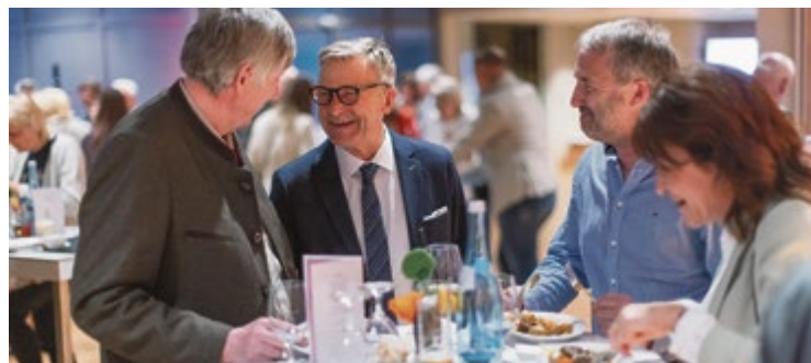
Veranstaltungen bieten auch die Möglichkeit zum direkten Kontakt mit WKS-Präsident Peter Buchmüller und Raum zur Vernetzung mit anderen Unternehmern.

Im Rahmen der Sommerfest-Roadshow durch die Salzburger Bezirke erhalten Mitglieder außerdem Einblicke in inspirierende Unternehmergeschichten, New-Work-Konzepte und innovative Ideen.