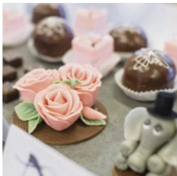
Die Lehrlinge des Salzburger Lebensmittelgewerbes lieferten beeindruckende Werkstücke.

In der Landesberufsschule 2 in Salzburg fanden kürzlich die diesjährigen Landeslehrlingswettbewerbe der Bäcker, Fleischer und Konditoren statt. Insgesamt stellten sich 13 Fleischverarbeiterinnen und Fleischverarbeiter bzw. Fleischverkäuferinnen und Fleischverkäufer, acht Bäckerinnen und Bäcker sowie 35 Konditorinnen und Konditoren den anspruchsvollen Wettbewerbsaufgaben. Bewertet wurden neben fachlicher Richtigkeit und handwerklicher Ausführung auch Kreativität, Hygiene, Organisation sowie die ansprechende Präsentation der Werkstücke.