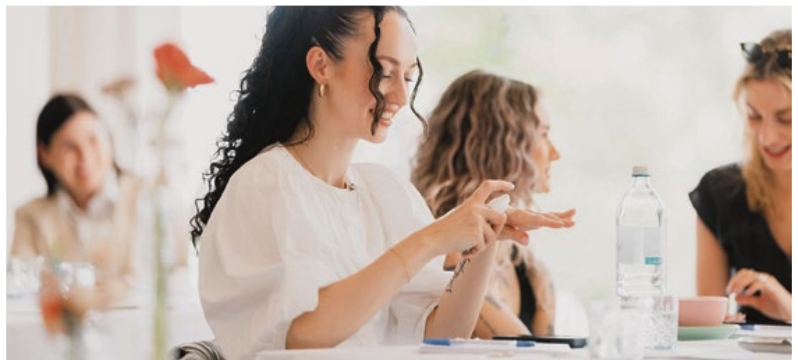
Bei einem Pre-Launch-Event in Wien wurde das Kosmetiksoriment von Seewald kürzlich der Öffentlichkeit präsentiert.