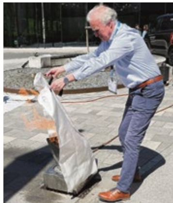
Besucher konnten verschiedene Löschmittel testen.

pflichtende Maßnahmen müssen Betriebe ab Hitzewarnstufe 2 treffen“, erläuterte Arno Gsell vom Arbeitsinspektorat Salzburg. Diese werde von der Geosphere Austria ausgelöst und entsprechend verbreitet. Eine der verpflichtenden Maßnahmen ist die Ausstattung bzw. Nachrüstung von Krankabinen und selbstfahrenden Arbeitsmitteln (Bagger, Radlader etc.) mit einer Kühlung. Außerdem müssen Arbeiter mit Sonnenschutz bzw. entsprechender Schutzbekleidung und Getränken versorgt werden.