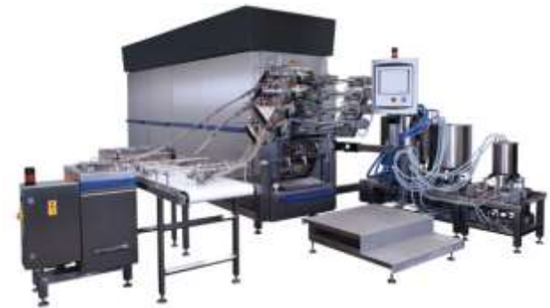
© Franz Haas Waffel- und Keksanlagen-Industrie GmbH