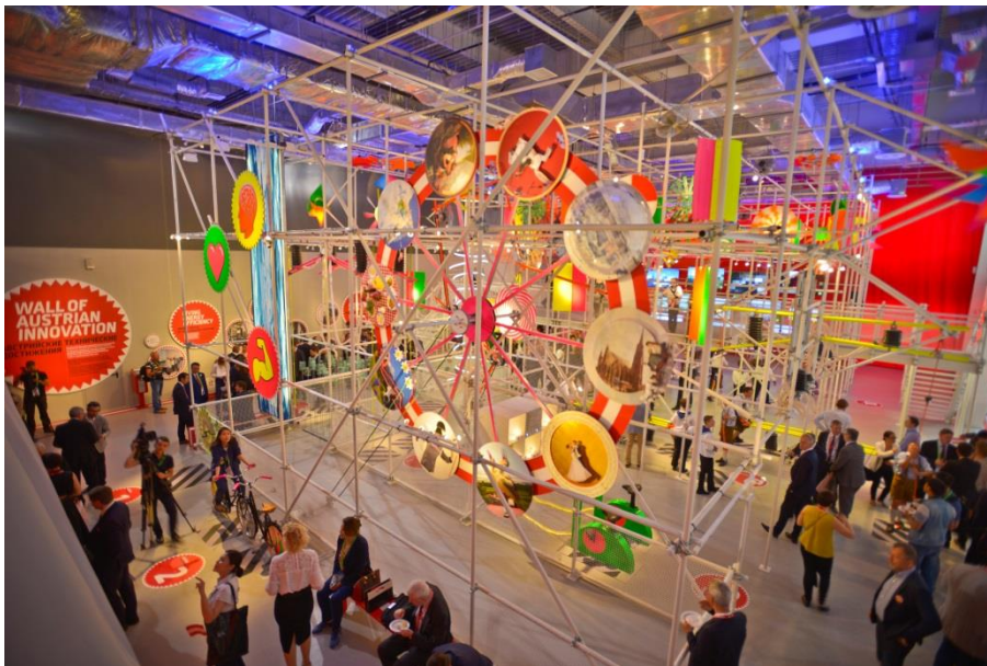
Action im Österreich Pavillons

Österreichische Unternehmen können den Österreich Pavillon für eigene Events nutzen , z.B. für Präsentationen, Kundenevents etc. Einige Firmen haben dies bereits erfolgreich gemacht und die Initiativen ausländischer Firmen wurden von den lokalen Partnern sehr geschätzt und auch medial gut aufgenommen, da der EXPO 2017 hohe Bedeutung zugemessen wird. Nutzen Sie daher noch rasch die letzten Wochen der EXPO für Ihren Event! Details sind auf www.expoaustria.at verfügbar.