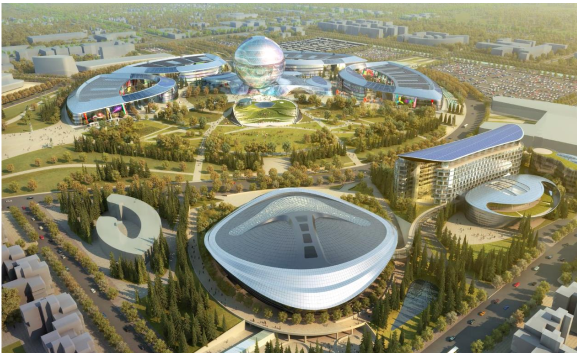
Schema EXPO Gelände

Ein Monat nach dem spektakulären Start der EXPO 2017 ist ein umfangreiches Veranstaltungsprogramm für internationale Experten und Besucher ( https://expo2017astana.com/en/events , www.futureenergyforum.com ) voll im Gange. Zukunftsenergie als Leitthema soll zu einer verstärkten Bewusstseinsbildung beitragen. Es soll an die globalen Herausforderungen im Energiebereich, weit über nationale Grenzen hinweg, erinnern und zu einer verantwortungsvollen Energiepolitik sowie zum Einsatz nachhaltiger Technologien animieren. Einerseits muss noch in vielen Ländern dieser Welt eine ausreichende Versorgung mit Energie sichergestellt werden, andererseits müssen die Industrienationen den Übergang von fossilen auf erneuerbare Energieträger bewältigen. Dabei wird neben grüner Energie, von Wasserkraft über Biomasse bis hin zu Wind- und Solarenergie, auch die Atomkraft berücksichtigt. Das EXPO Ausstellungsgelände umfasst 25 Hektar, daneben wurden u.a. noch Wohnkomplexe, ein Shopping- und ein Kongresscenter errichtet. Das Architekturkonzept für die EXPO 2017 stammt vom US-Architekten Adrian Smith + Gordon Gill und wird gekrönt von der weltweit größten Sphäre – dem Kasachstan Pavillon – mit 80 m Durchmesser und 100m Höhe.