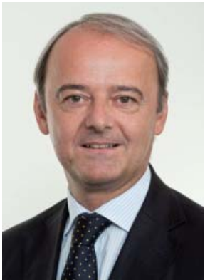
Von Dr. Johann Brunner

Beatles oder Stones, Rapid oder Austria – mit ähnlich ideologischer Inbrunst wie die verbalen Gefechte zwischen den Vertretern dieser musikalischen bzw. sportlichen Lager wurde bis vor wenigen Jahren die Debatte zwischen Befürwortern von Mehrweg- bzw. Einwegverpackungen geführt. Die Getränkeindustrie bot stellvertretend für die gesamte Wirtschaft den Schauplatz der Diskussionen rund um Quoten, Pfänder, Ökobilanzen und Recyclingtechnologien.