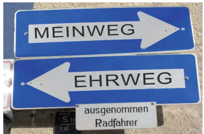
Wohin geht der Markttrend? – Wesentlich ist letztlich die CO 2 -Bilanz.

Die Zeche zahlt letztlich der Konsument. Und der sieht nicht ein, warum – schon gar nicht in wirtschaftlich angespannten Zeiten. Denn die historische Gleichung „Mehrweg gut – Einweg schlecht“ ist im Jahr 2009 längst ein Anachronismus geworden. Pet-to-Pet-Recycling, das aus Einwegflaschen wieder neue Einwegflaschen macht, drastische Gewichts- und Schadstoffreduktionen beim Produkt, Energieeinsparungen im Herstellungsprozess – all das beweist, dass die Menschen mit reinem ökologischen Gewissen zu Einweggebilden greifen können. Im Zuge dieser Entwicklung werden Stoffkreisläufe geschlossen, mit neuen Möglichkeiten der Recyclingtechnologie hochqualitative Sekundärrohstoffe geschaffen,