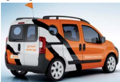
Vehikel zum Workshop am 10. November: Fiat Fiorino mit Elektroantrieb.

Der Workshop Anfang September führte zur S.Spitz GesmbH nach Attnang-Puchheim. Seit 2006 ist dort eine Kraft-Wärme-Kopplungsanlage auf Biomassebasis im Einsatz, die Dampf für den Betrieb, Nahwärme für den Ort und zusätzlich Strom liefert. DI Helmut Gahbauer von der Brau Union zeigte Energie-sparpotenziale im Brauverfahren auf.