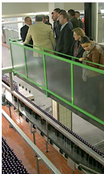
Nachhaltigkeitsworkshop in Göss

Die Brauerei Göss befindet sich in der Realisierungsphase. Mit den ersten Schritten ist der Gesamtenergieverbrauch pro Hektoliter in den Sommermonaten auf 42 MJ gesenkt worden. Im Branchendurchschnitt sind es 62 MJ/hl.