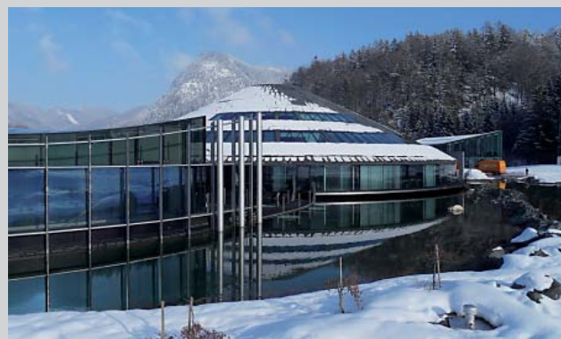
BITTE VORMERKEN! Workshop bei Red Bull, 20. Mai

Eine Besichtigung der Red-Bull-Zentrale in Fuschl sowie des Hangar 7 in Salzburg steht ebenfalls auf dem Programm.