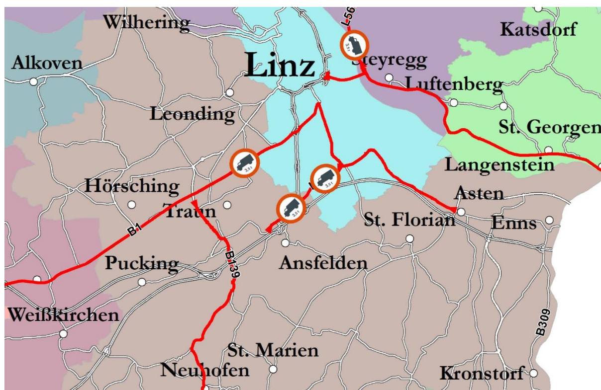
Grafik: Land OÖ, DORIS Systemgruppe

Für den Durchzugsverkehr mit LKW über 3,5 t höchstzulässigem Gesamtgewicht gibt es auf vielen möglichen Ausweichrouten Fahrverbote (Fahrverbot für Lastkraftfahrzeuge auf bestimmten Straßenstrecken im Bundesland Oberösterreich LGBL. Nr. 37/2004 idgF - siehe rot gekennzeichnete Strecken in der folgenden Grafik).