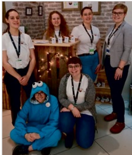
Die Siegerinnen des Landeswettbewerbs in Salzburg, JUNIOR Company „Im Glas“, HBLA Ursprung.