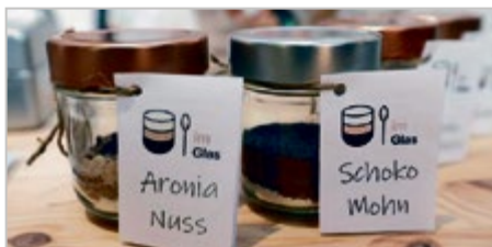
Backmischung „Im Glas“,