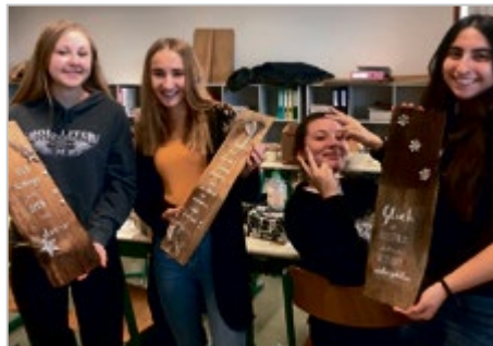
„Slogan Art“ der HAK Neumarkt.