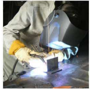
Fachkräfte sind stärker gefragt denn je.