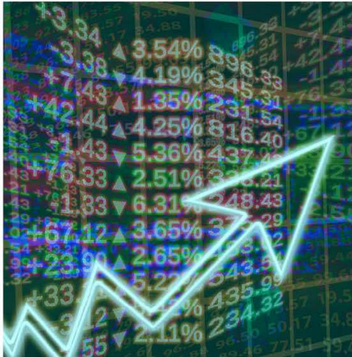
Die Zahlen des aktuellen Wirtschaftsbarometers zeigen: Die Konjunktur im Großraum Graz gewinnt deutlich an Dynamik.

„Man merkt, die Konjunktur nimmt wieder deutlich Fahrt auf und die Stimmung der Unternehmen in der ganzen Steiermark und besonders im Großraum Graz ist spürbar besser als etwa noch im Herbst 2016“, zieht Larissegger Bilanz. „Diese Zahlen decken sich auch mit den Eindrücken, die bei den rund 130 Betriebsbesuchen im vergangenen Frühjahr gesammelt werden konnten“, schildert Larissegger erfreut. Leder