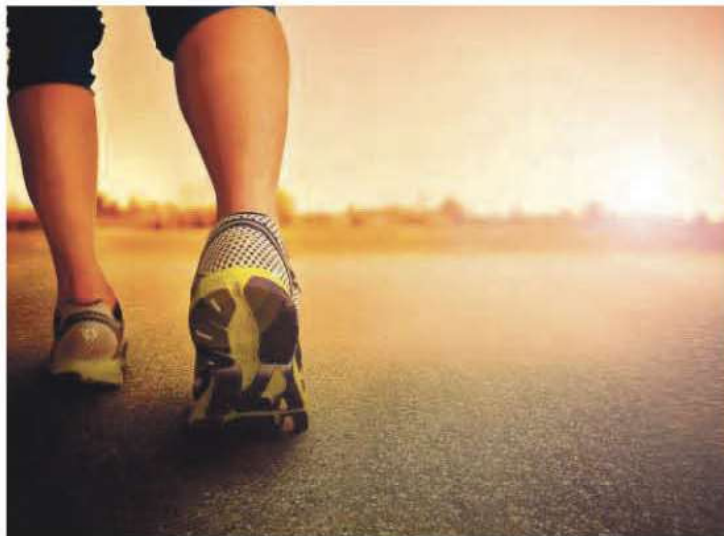
Sports Direct bietet die richtige Laufausrüstung, damit auch im Sommer dem Training nichts im Wege steht.

Laufen ist ein Ganzjahressport und macht auch bei Hitze Spaß, jedoch sollte man auf einige Dinge achten. Wenn das Thermometer die 30-Grad-Marke überschreitet ist Vorsicht geboten. An heißen Tagen sollte man die Trainingseinheiten am frühen Morgen oder späten Abend absolvieren. Vor dem Training muss ausreichend Flüssigkeit getrunken werden. Wenn man beim Laufen länger als eine Stunde unterwegs ist, muss unbedingt eine Flasche Wasser mitgenommen und regelmäßig während der Belastung in kleinen Mengen getrunken werden.