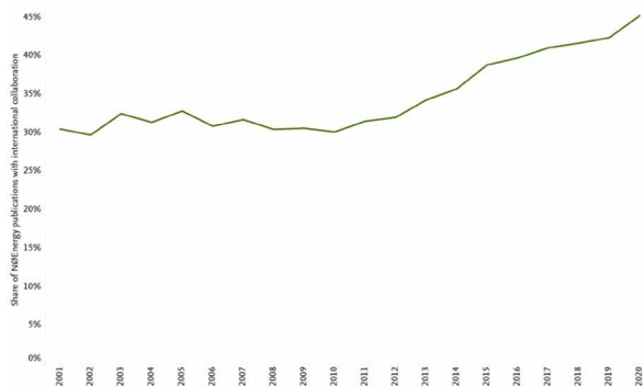
Anteil der NØEnergy-Publikationen mit internationaler Zusammenarbeit 2011-2020. Quelle: Pathways to Net Zero: The Impact of Clean Energy Research, 2021

nicht überdurchschnittlich bewertet werden. Sofern diese Zusammenarbeit nicht weiter ausgebaut werden kann, ist zu befürchten, dass die NØEnergy-Forschung möglicherweise nicht die notwendigen interdisziplinären Ausmaße erreicht, um groß angelegte technische und gesellschaftliche Veränderungen zu realisieren, die für das Erreichen der Netto-Null-Ziele erforderlich wären.