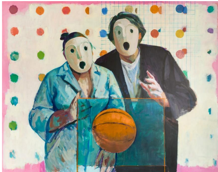
Xenia Hausner, Rosemarie's baby (das Staunen-Bild) , 2010, Sammlung Ploil © Xenia Hausner/Bildrecht Wien, 2020

Pressebilder: https://celum.noeku.at/pinaccess/showpin.do?pinCode=SammlungPloil