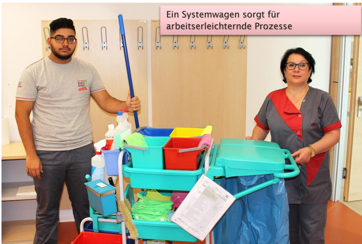
Ein Systemwagen sorgt für arbeitserleichternde Prozesse