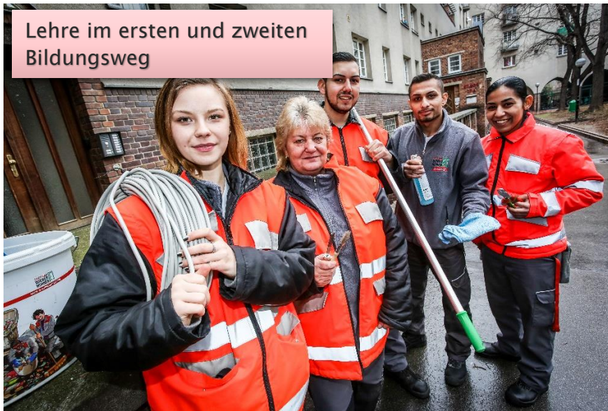
Lehre im ersten und zweiten Bildungsweg