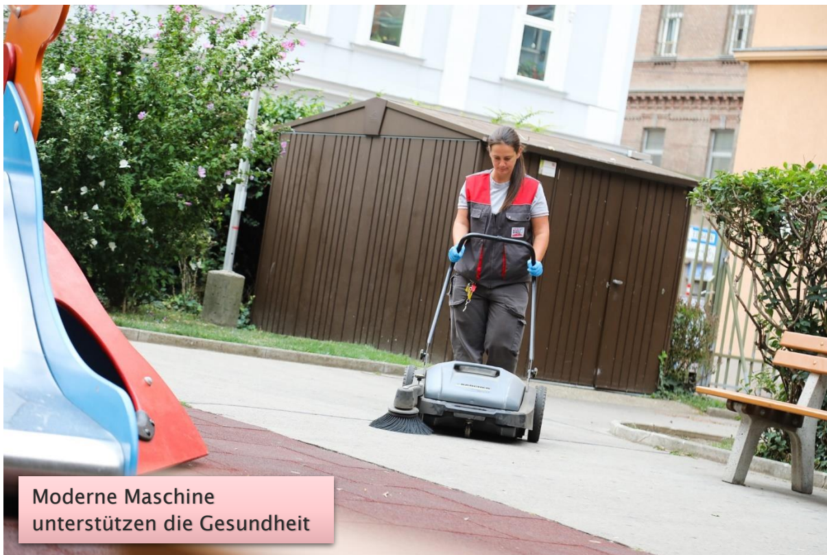
Moderne Maschine unterstützen die Gesundheit