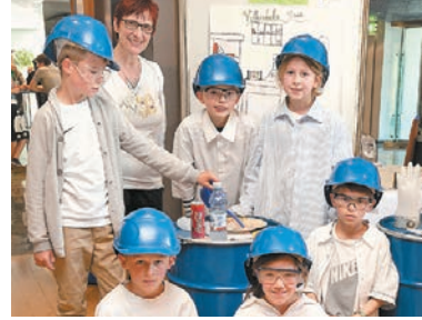
Die Volksschule Stanz gewann die Sonderkategorie Volksschule mit ihrem Projekt „Karbid 4 6+1“.

(dgh) Die Volksschule Stanz hat mit einem Karbid-Projekt den Wettbewerb „Jugend forscht in der Technik“ gewonnen.