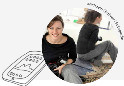
Michaela Grabner | Fotografin