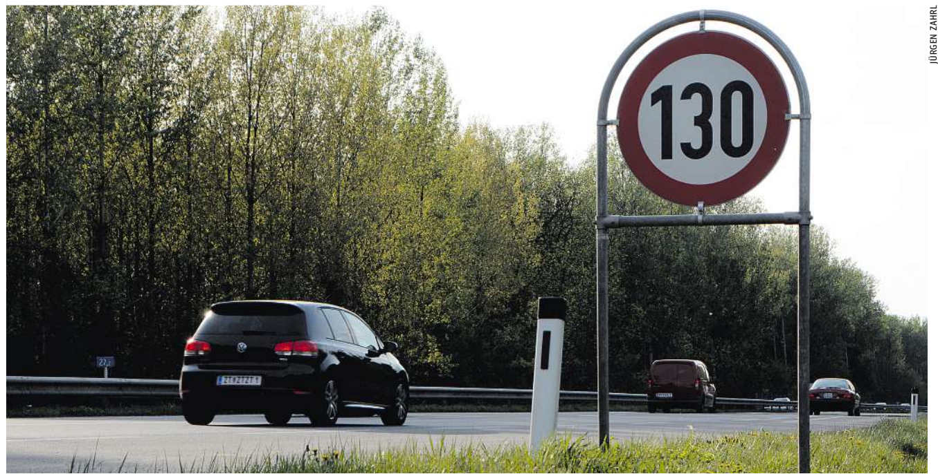
Ob die Folgeplanung für eine Waldviertelautobahn in Angriff genommen wird, will man anhand einer Prüfung spätestens Ende 2021 wissen