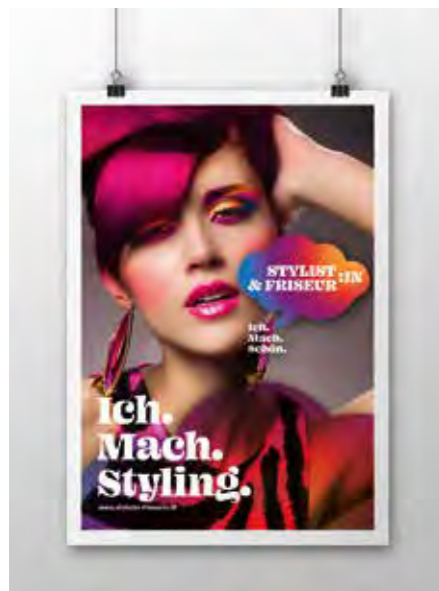
Poster Sujet 1