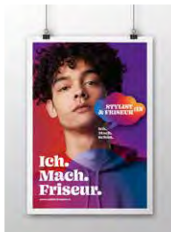
Poster Sujet 2