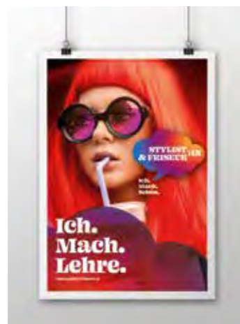
Poster Sujet 3