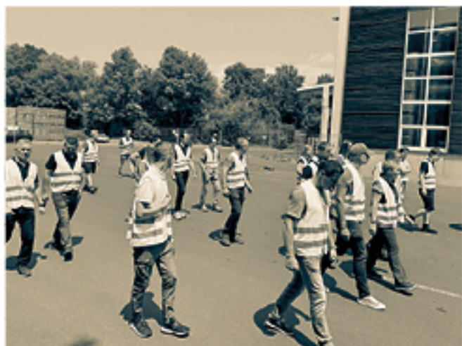
Ausbildertreffen bei Scheucher Parkett im Juni