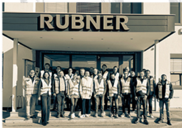
Ausbildertreffen bei RUBNER Holzindustrie im November