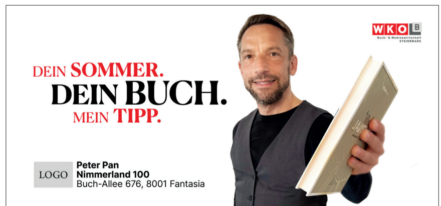
Kampagnensujet Variante 1

Sie stehen zentral im Bild und halten dem Kunden dabei ein Buch entgegen oder Sie sitzen auf einem Buchstapel.