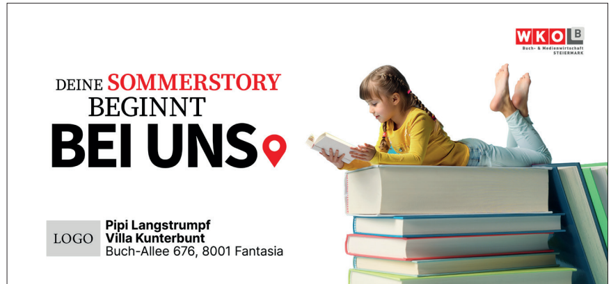
Kampagnensujet Variante 3

Zusätzlich wird es in ausgewählten Gemeinden, in denen keine Buchhandlung an der Plakataktion teilnimmt, ein neutrales Plakat geben, das allgemein die Rolle des regionalen Buchhandels betont.