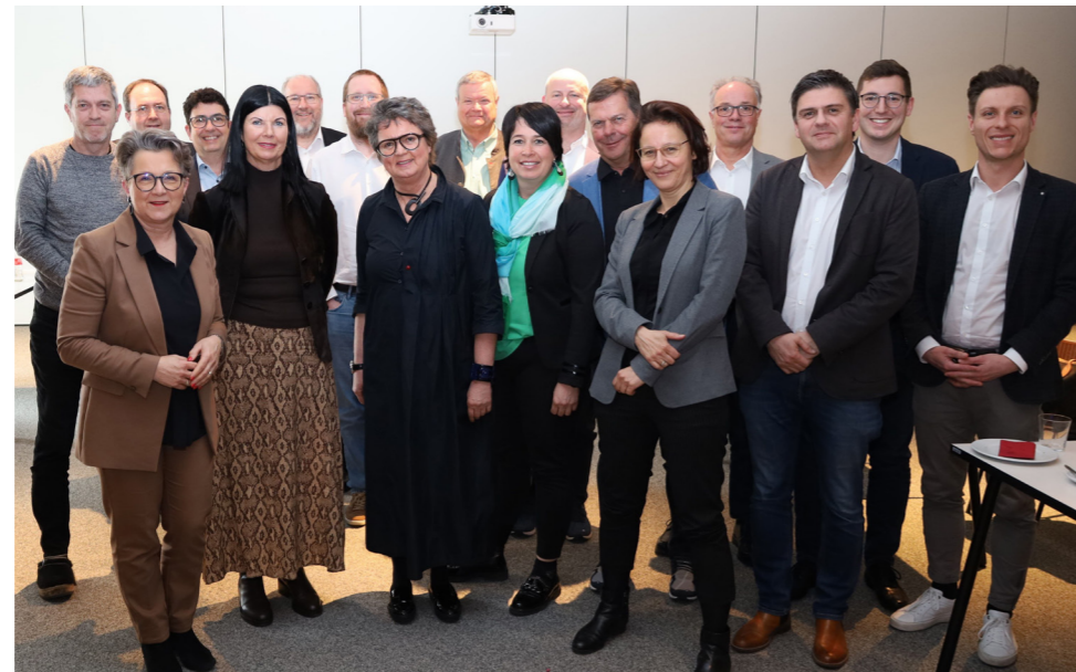
Die Abfalltransporte via Bahn waren bei jeder Fachverbandsausschusssitzung ein zentrales Thema.