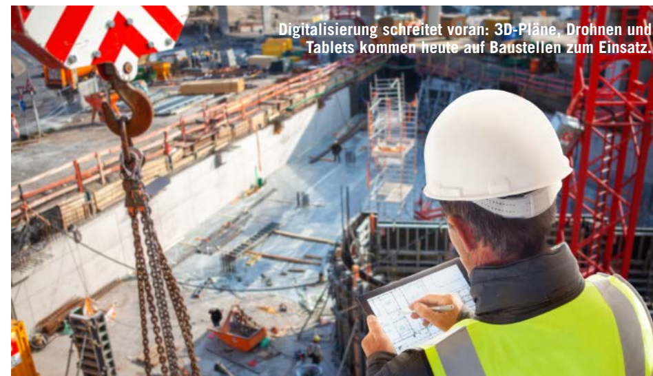
Digitalisierung schreitet voran: 3D-Pläne, Drohnen und Tablets kommen heute auf Baustellen zum Einsatz.

Matura und was jetzt? Auch für Maturanten gibt es eine ideale Einstiegschance in die Baubranche. Starte im trialen Ausbildungssystem und mit einer verkürzten Lehrzeit deine berufliche Laufbahn. Der praktische Teil basiert auf einer Vollzeitstellung mit einem Trainee-Programm im Lehrbetrieb. Die Theorie umfasst einen dreimal 9-wöchigen Lehrgangsunterricht an der Fachberufsschule, der in ständiger Zusammenarbeit