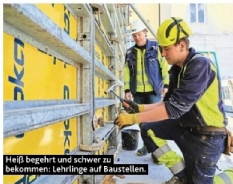
Heiß begehrt und schwer zu bekommen: Lehrlinge auf Baustellen.