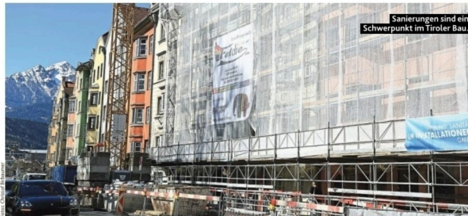
Sanierungen sind ein Schwerpunkt im Tiroler Bau.