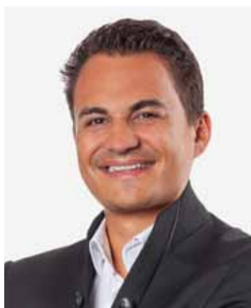
Mag. Thomas Höpperger