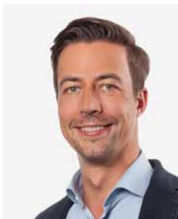
Mag. Matthias Zitterbart

Wir wünschen dem neuen Ausschuss viel Erfolg!