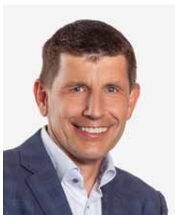
Christian Sailer © DieFotografen