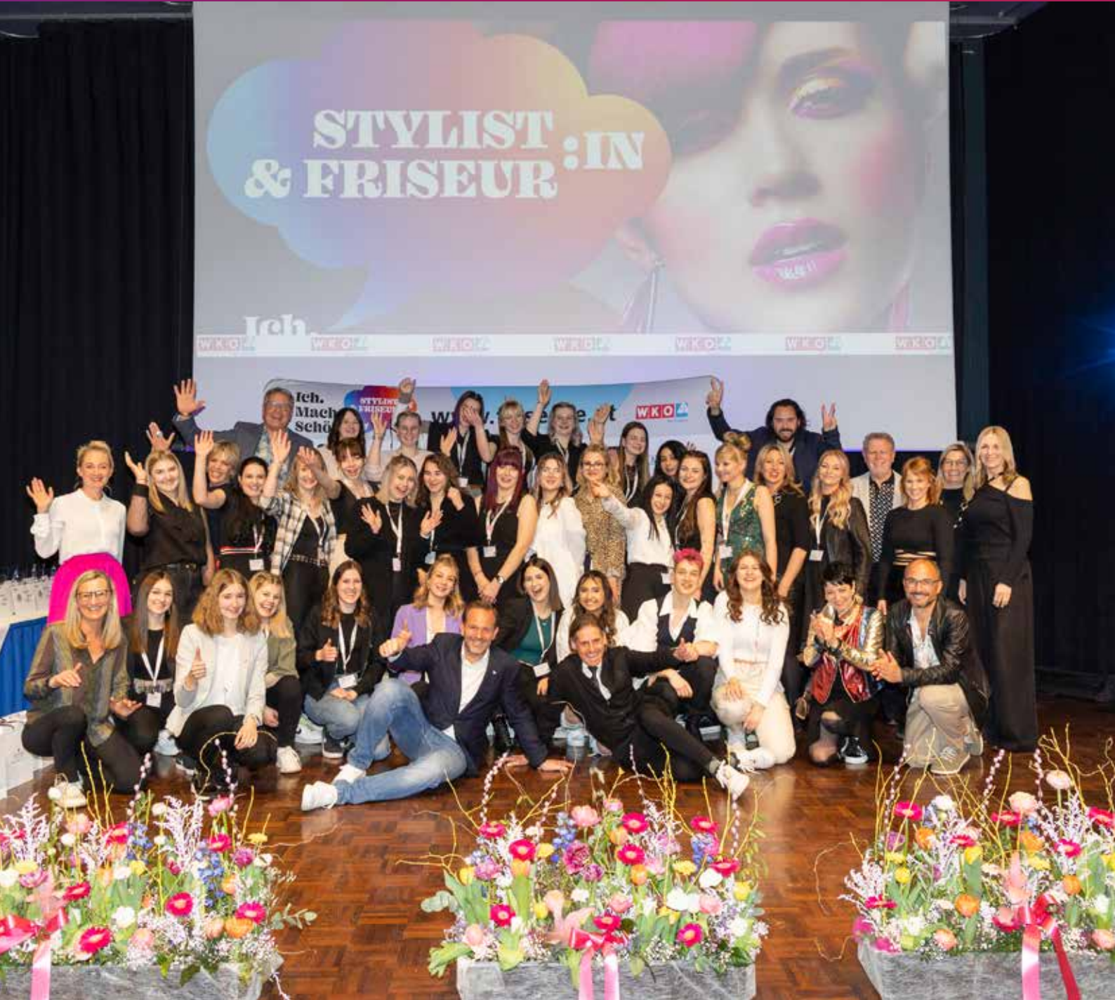
Alle Teilnehmer:innen des TyrolSkills Landeslehrlingswettbewerbs 2023.

Mit Unterstützung der Partner der Industriekooperation