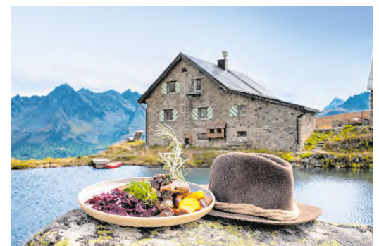
Ausgewählte Hütten und Almen im Paznaun verwandeln sich wieder in besondere Genussstationen.

Weitere Informationen gibt es unter www.paznaun-ischgl.com