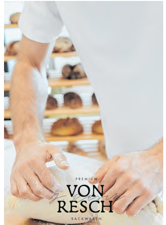
Die Premium-Linie steht für österreichische Backtradition, regionale Verantwortung und Genussmomente.

Alle Informationen zur Produktlinie „Von Resch“ und allen anderen Produkten finden Sie unter www.resch-frisch.com