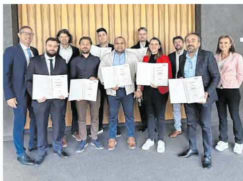
Sieben neue Kandidat:innen haben die Prüfung der gewerblichen Vermögensberatung erfolgreich bestanden und starten nun motiviert in die Branche.