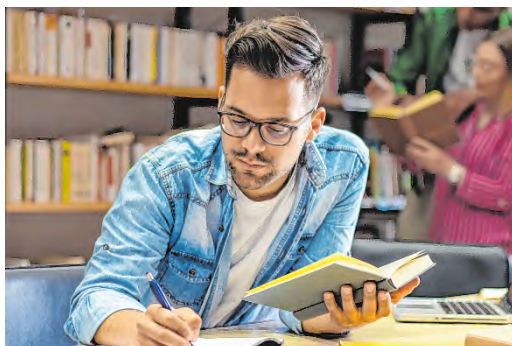
Voraussetzung für die Bildungskarenz ist eine Vereinbarung zwischen Arbeitgeber:in und Arbeitnehmer:in.

Die Dauer der Bildungskarenz kann zwischen