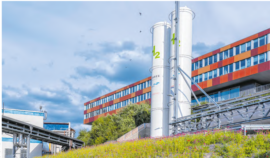
Weithin sichtbar: Die beiden Wasserstoff-Speicher am Plansee-Standort Reutte mit grünem H 2 -Schriftzug.