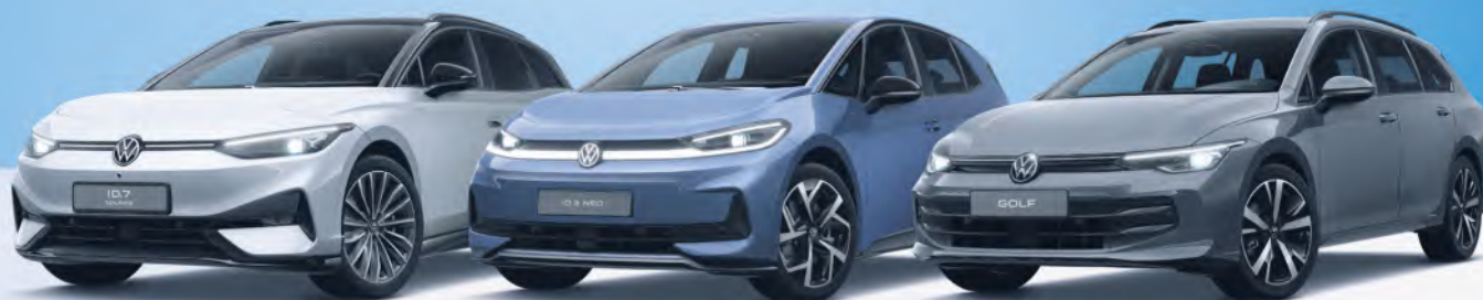
Der ID.7 Tourer