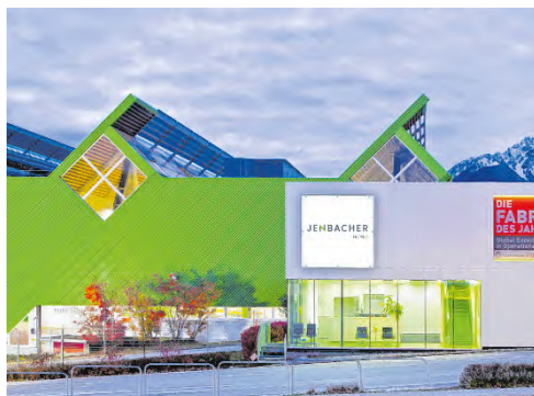
Hauptsitz der Innio in Jenbach. Der Tiroler Gasmotorenhersteller legte beim Börsenstart an der NASDAQ einen starken Auftakt hin.