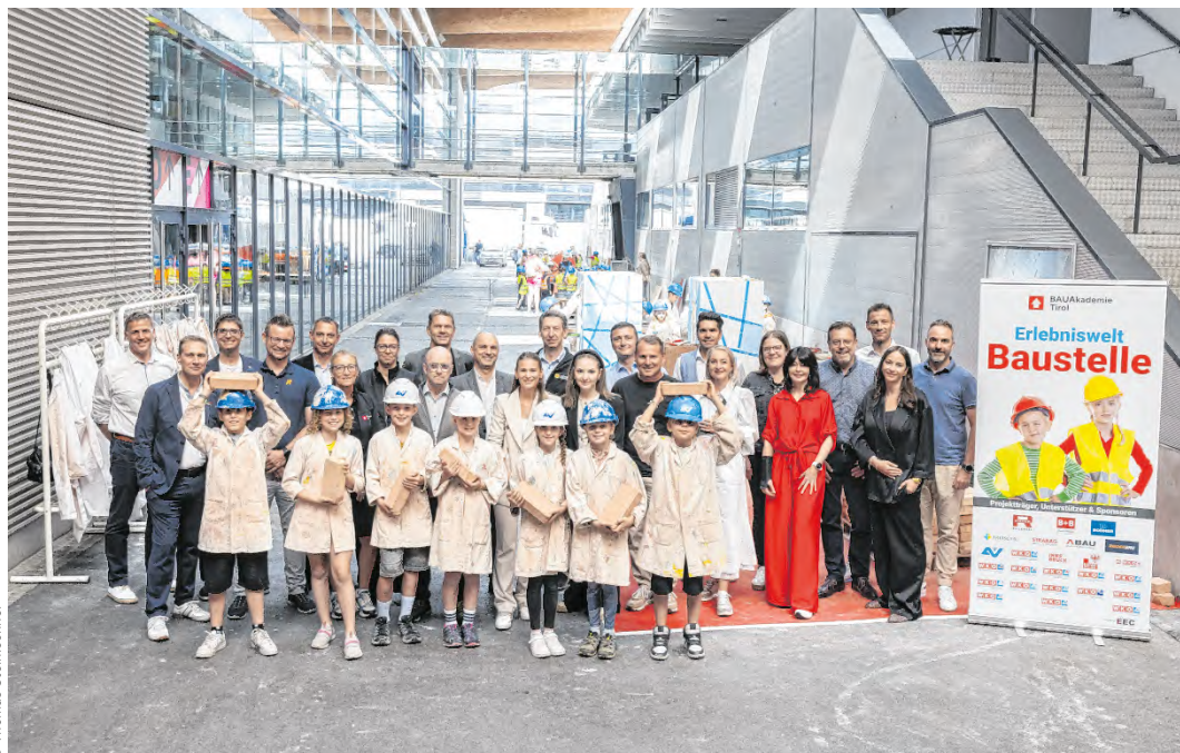
Voller Erfolg: Rund 5.000 Tiroler Volks- und Mittelschüler schnupperten bei der „Erlebniswelt Baustelle“ in 16 Handwerksberufe hinein – sehr zur Freude der Partner:innen und Organisator:innen der Aktion.