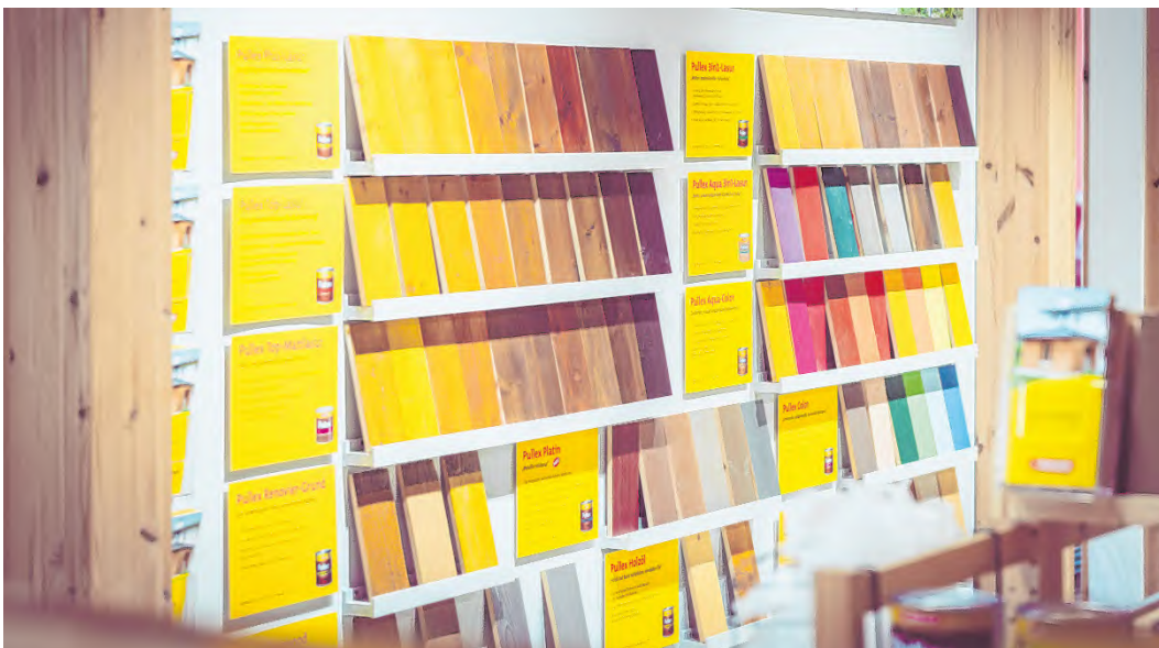
Farbmuster statt KI-Assistent. Bei Tirolack kann man Farben auch außerhalb der Dosen sehen und sogar fühlen.