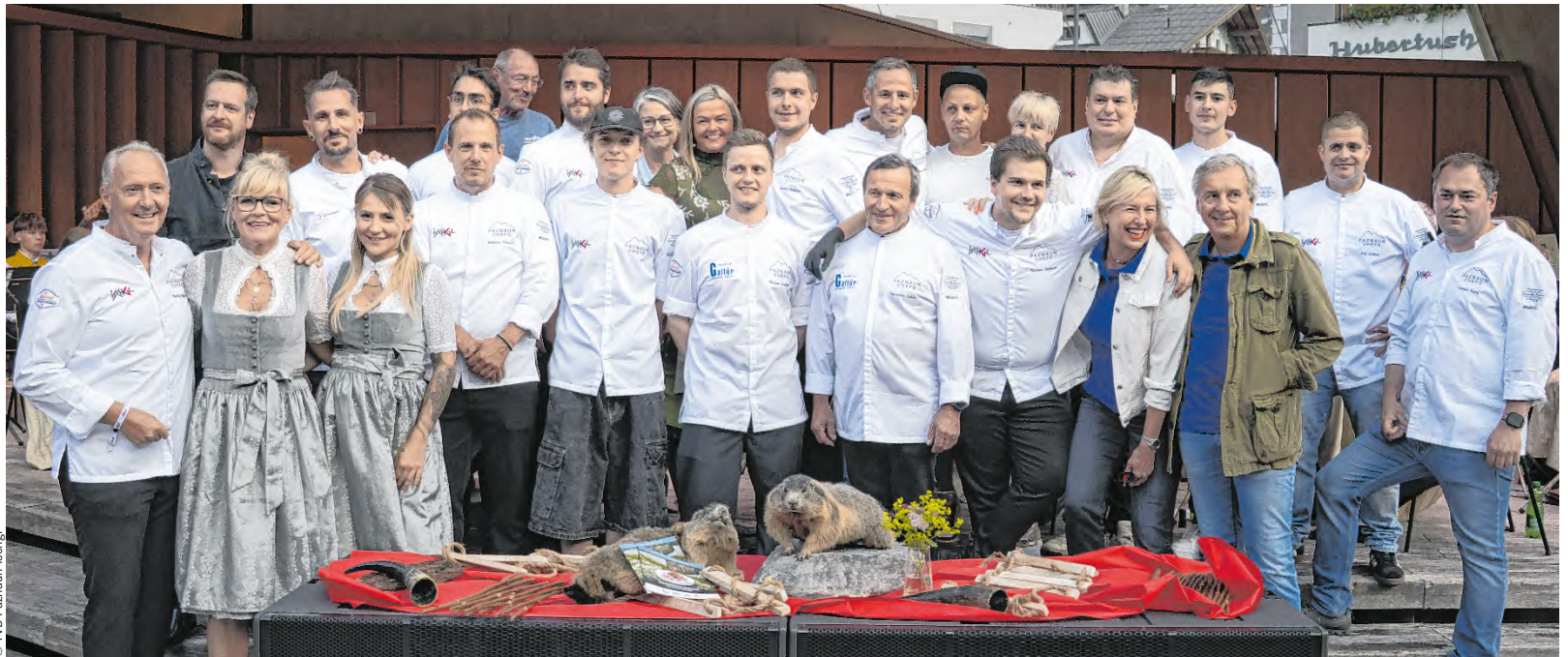
Wenn Spitzenköche auf Berghütten treffen, wird der Paznauner Almsommer zum Hochgenuss. Verarbeitet werden vorwiegend heimische Zutaten: Paznauner Almkäse, regionales Fleisch, frische Kräuter sowie traditionelle Getreidesorten. Die Gerichte erzählen von Herkunft, Handwerk und alpiner Identität – modern interpretiert und doch tief verwurzelt.