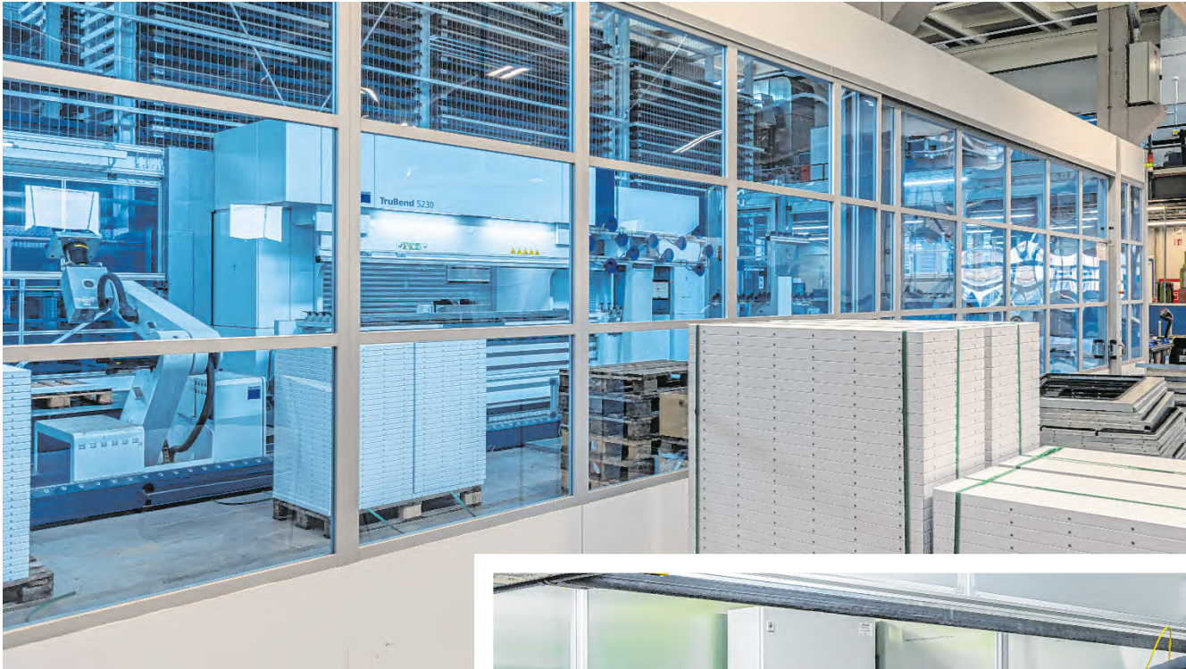
Das Werk in Sillian wird stetig modernisiert – allein in der letzten Dekade sind am Standort Investitionen in Höhe von rund 20 Millionen Euro getätigt worden.