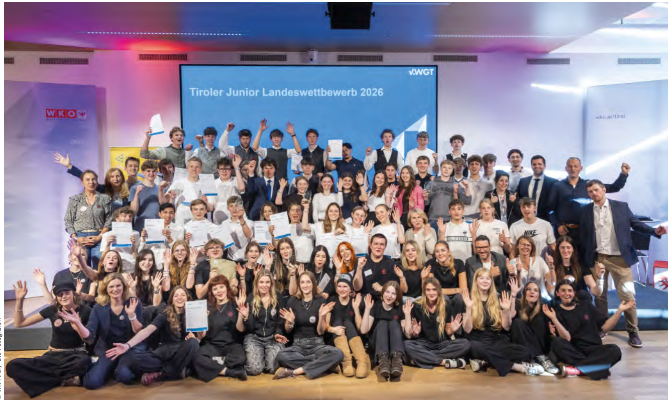
Engagierte Schüler:innen, begeisterte Jury-Mitglieder – das Finale des Junior Landeswettbewerbs 2026 in der Wirtschaftskammer Tirol war ein voller Erfolg.