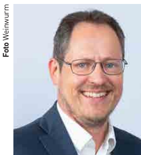
Rainer Trefelik, Obmann der Bundessparte Handel in der Wirtschaftskammer Österreich (WKÖ).

Der heimische Einzelhandel weist das vierte Quartal in Folge ein reales Umsatzminus auf: So betrug der Umsatzanstieg im 1. Quartal nominell zwar 6,7%. Berücksichtigt man die Preiserhöhungen, entspricht dies den Daten des Economica Instituts für Wirtschaftsforschung zufolge aber einem realen Minus von 2,9%. „Dazu kommt, dass die Preisentwicklung im Einzelhandel mit 9,6% unter der allgemeinen Inflationsrate liegt, die im 1. Quartal 10,4% betrug. Der heimische Handel ist also nicht für die hohe Inflationsrate verantwortlich“, sagt Rainer Trefelik, Obmann