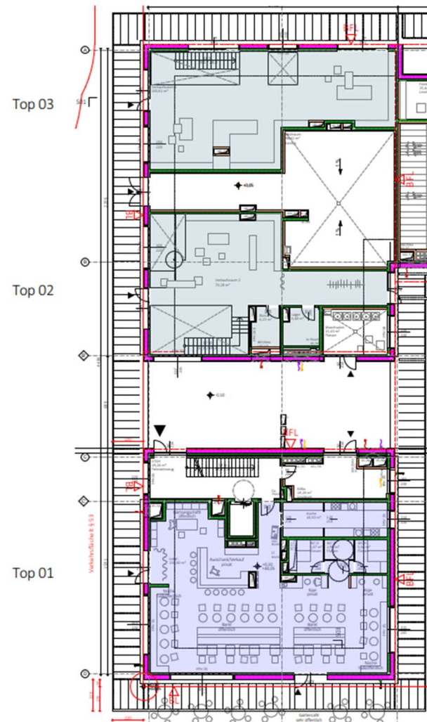
Grundriss Untergeschoss und Erdgeschoss Gewerbeflächen